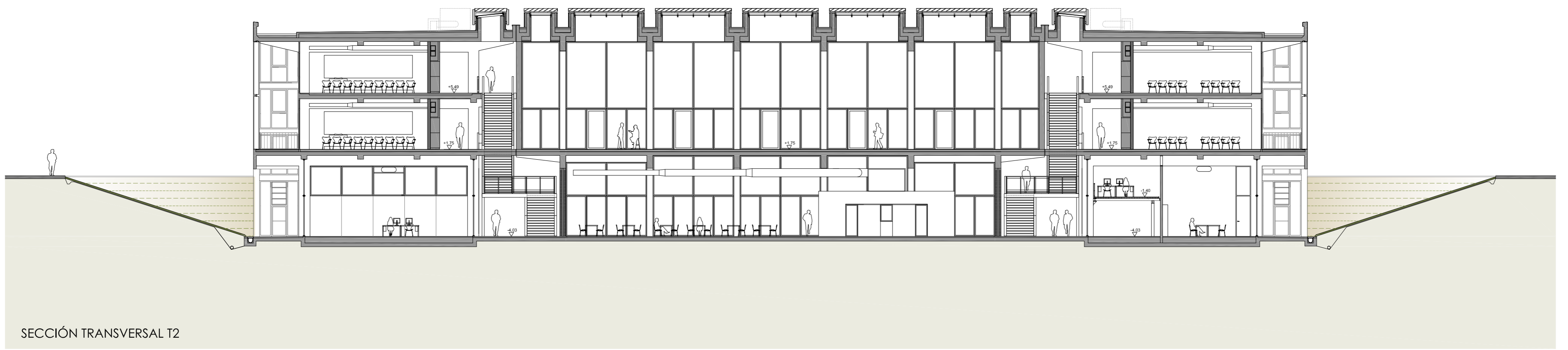
SECCIÓN TRANSVERSAL T2