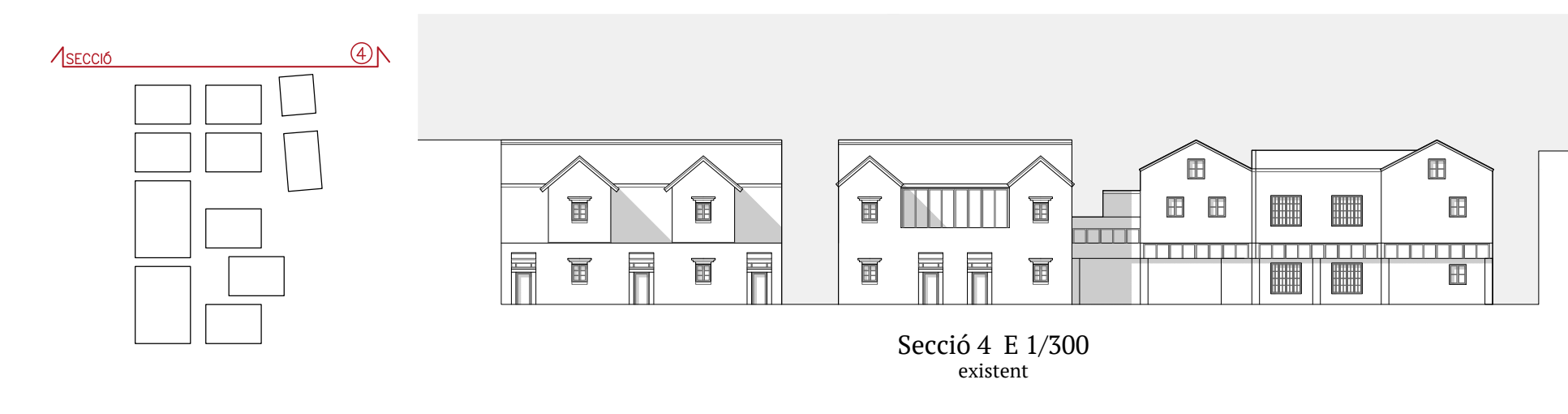
Secció 4 E 1/300 existent