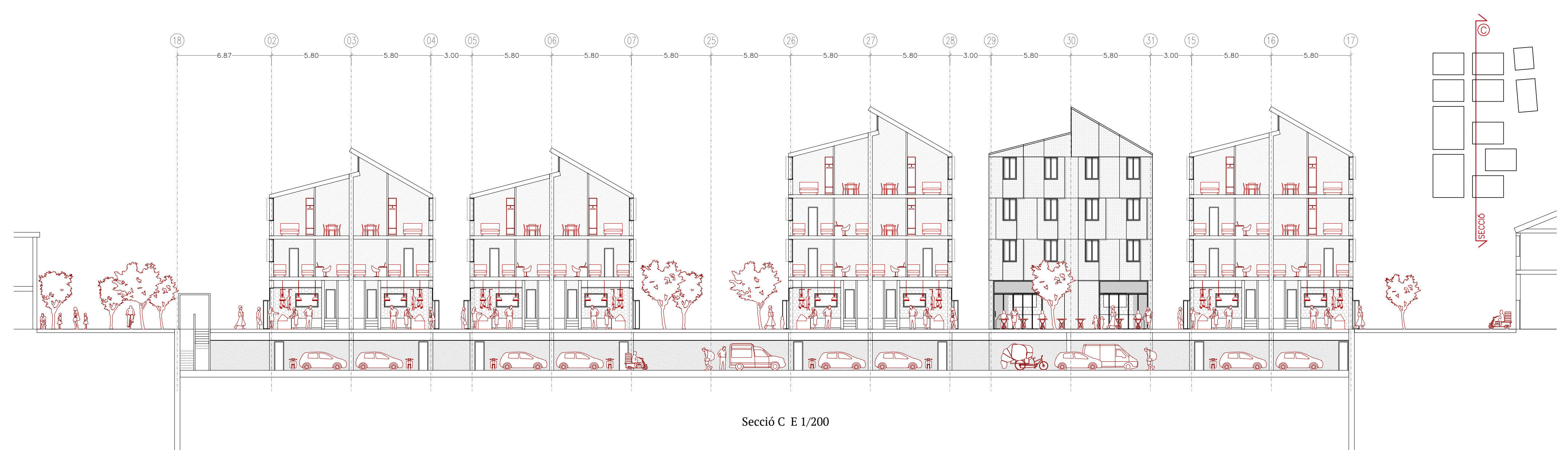
Secció C E 1/200