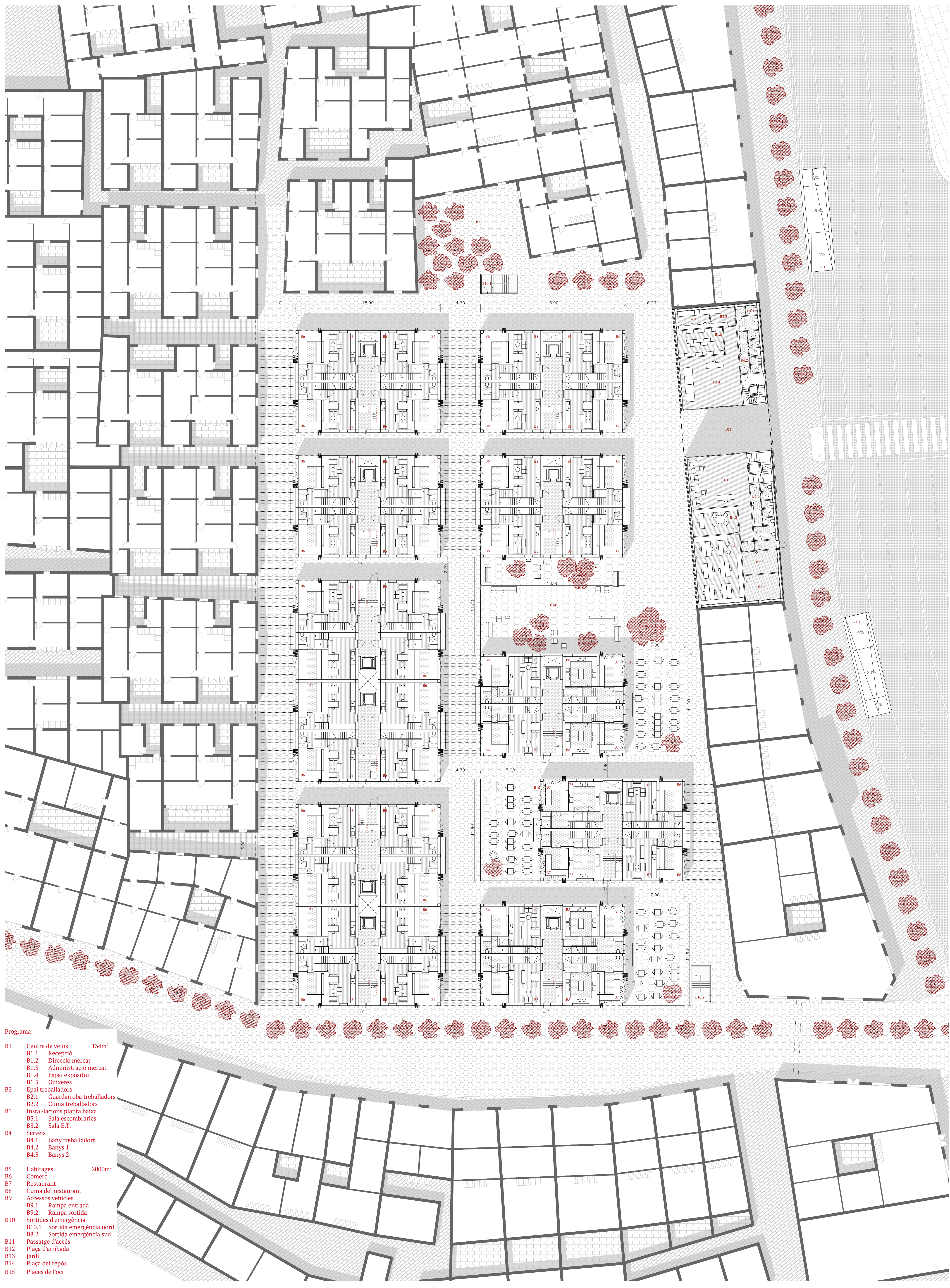
Planta Baixa +0m E 1/200