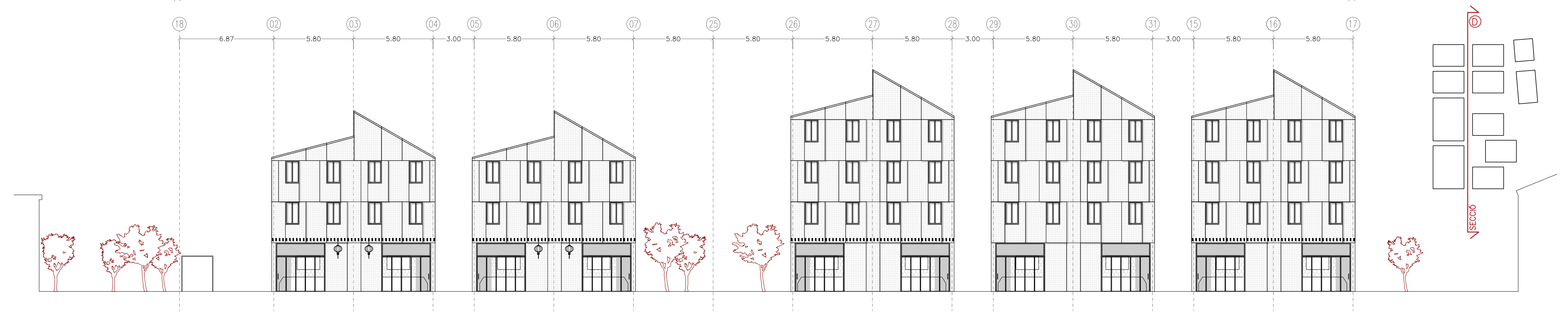
Secció D E 1/200