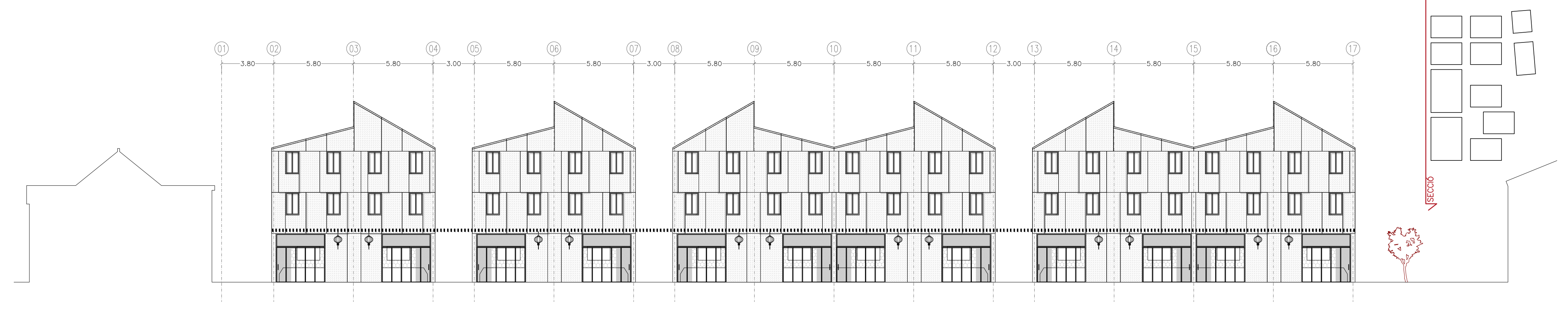
Secció F E 1/200