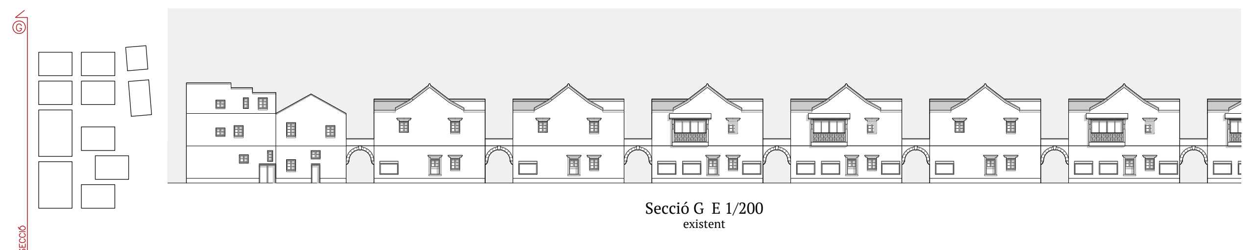
Secció G E 1/200 existent