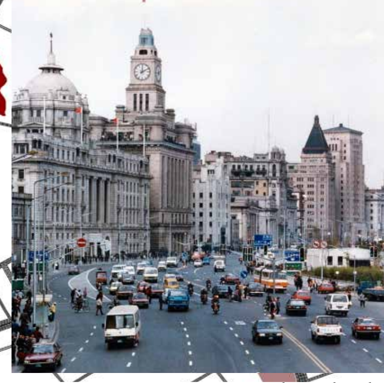
Extrangers arriben a Shanghai Anglesos, francesos i americans