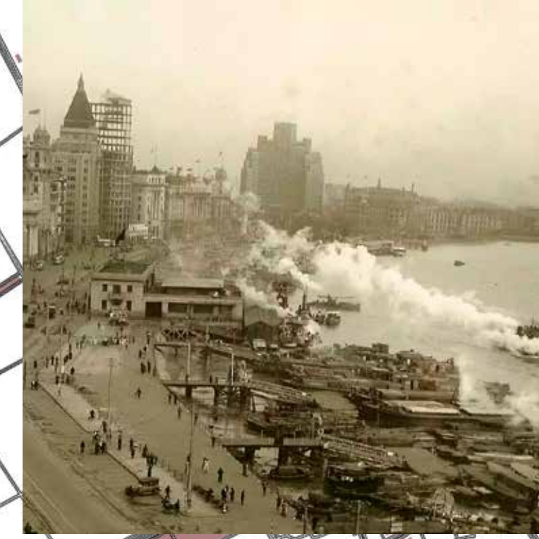
Batalla de Shanghai, els japonesos se n'apropien fins a 1945. Any 1937