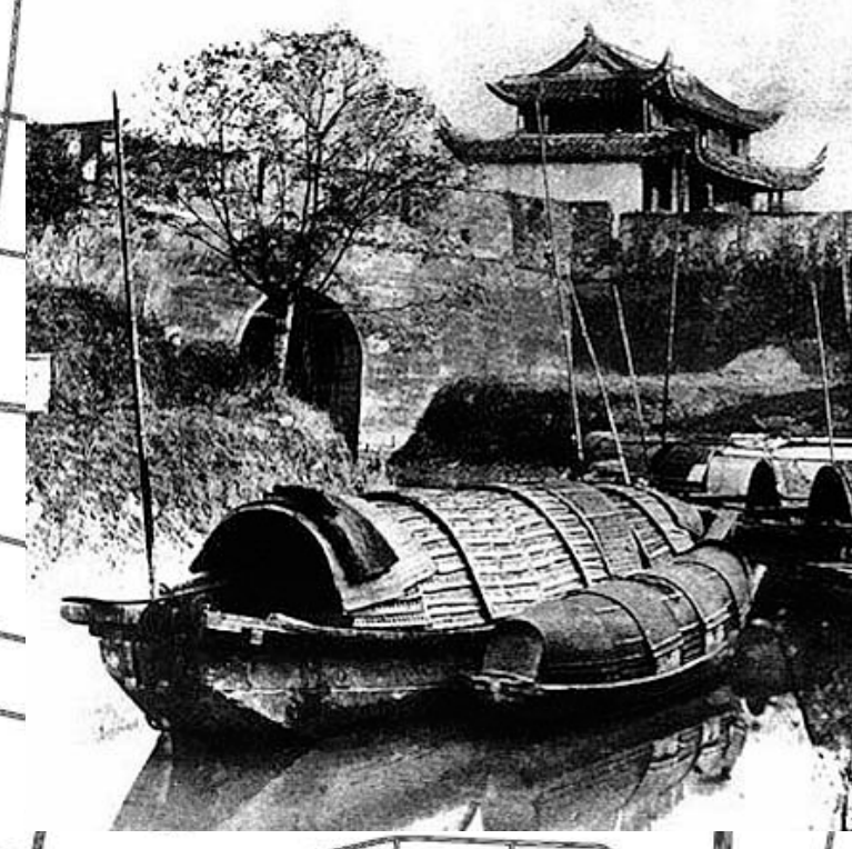
Shanghai s.XIII, poble pescador dinasties Han i Tang