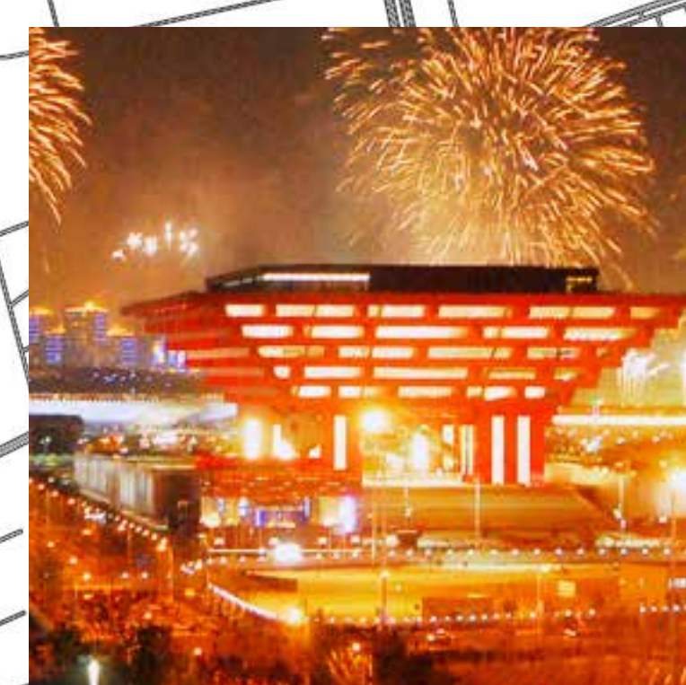
Expo Universal 2010 a Shanghai Demostració al món de la potencia de la ciutat