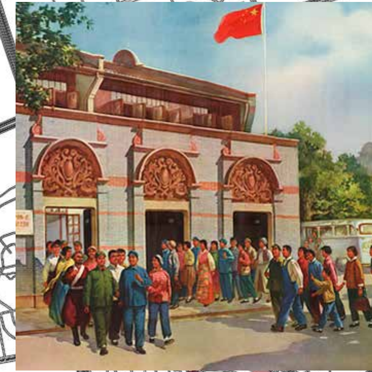
Fundació a Shanghai del partit comunista. Any 1921 Invasió de Mao al 1949.