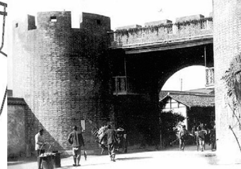
construcció de les muralles, s.XVI, dinastia Ming