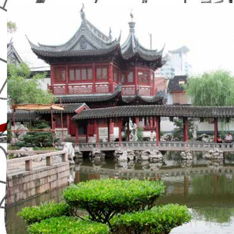
Jardins Yu Yuan s.XVI, dinastia Ming