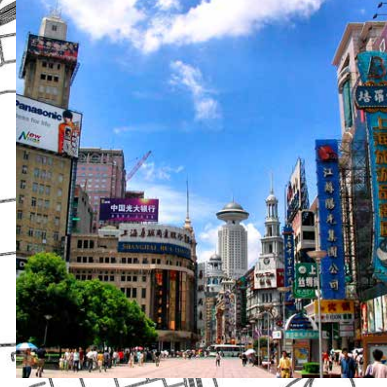
Nova imatge de la ciutat. Modernització de Deng Xiaoping a partir de 1992.