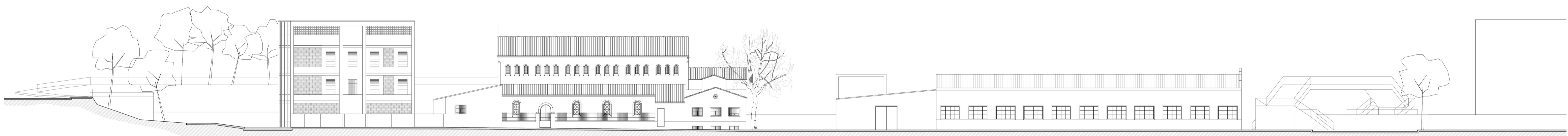
ALÇAT GENERAL SUD