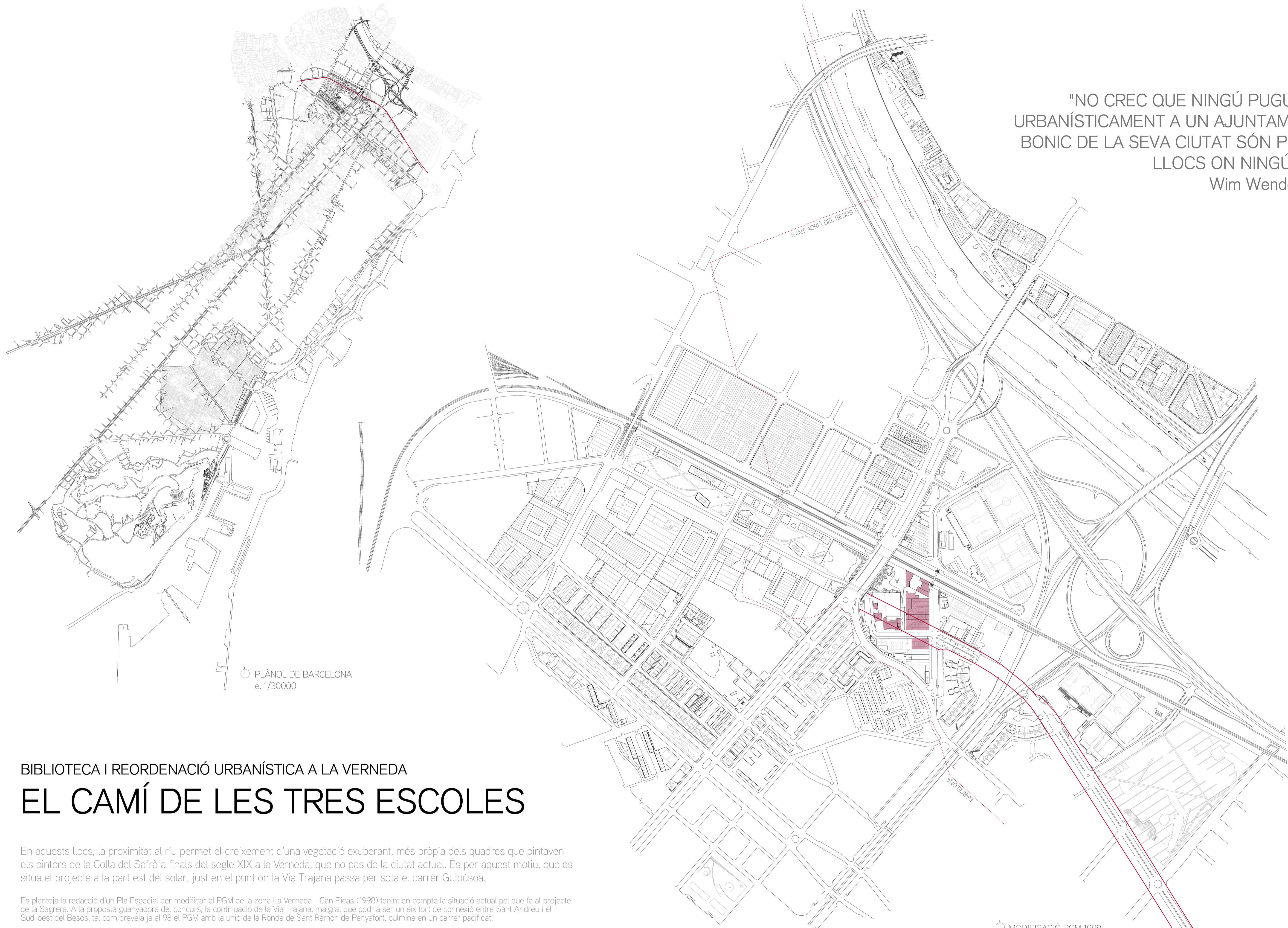
PLÀNOL DE BARCELONA e. 1/30000

"NO CREC QUE NINGÚ PUGUI FER ENTENDRE URBANÍSTICAMENT A UN AJUNTAMENT QUE EL MÉS BONIC DE LA SEVA CIUTAT SÓN PRECISAMENT ELS LLOCS ON NINGÚ NO HA FET RES" Wim Wenders, Quaderns 177.