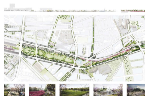
Proposta guanyadora del concurs del Parc de la Sagrera, on la Via Trajana culmina com un carrer pacíficat. Autors: WEST B - PCR - Alsay, Javier