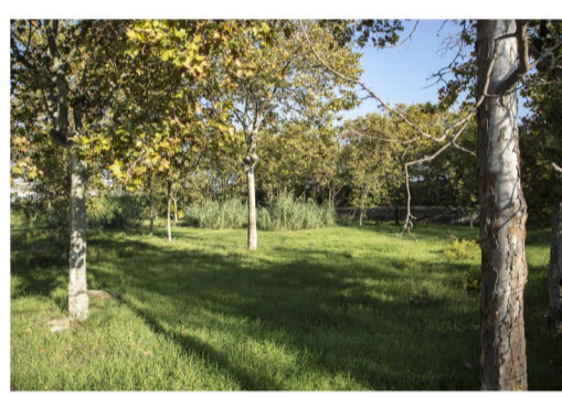
Fotografia de la cantonada est del solar proposat. Espai verd tancat situat al costat del pas soterrat de la Via Trajana.

Tenint en compte aquest fet, mantenint la connexió proposada pel PGM, es considera en aquest punt, també, una pacificació de la via i, alhora, un canvi en el seu traçat per tal d'evitar l'enderroc de la Parròquia i l'Escola Santes Juliana i Semproniana. Aquest Pla Especial defineix la reordenació, el canvi d'equipament i el nou programa, i la seva motivació principal és la reactivació de l'activitat social d'una zona límit propulsant la connexió entre dos barris.