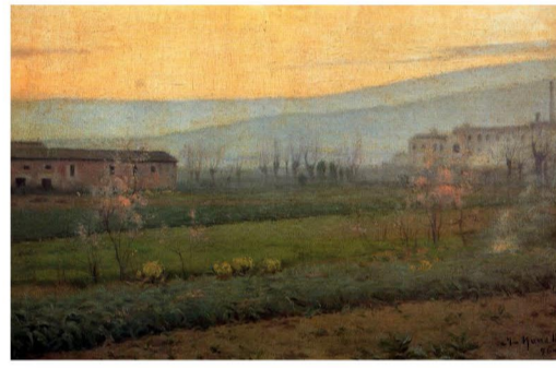
Isidre Nonell, 1896 - Capvespre a Sant Martí de Provençals. Pintor pertanyent al grup d'artistes barcelonins la Colla del Sifrà.