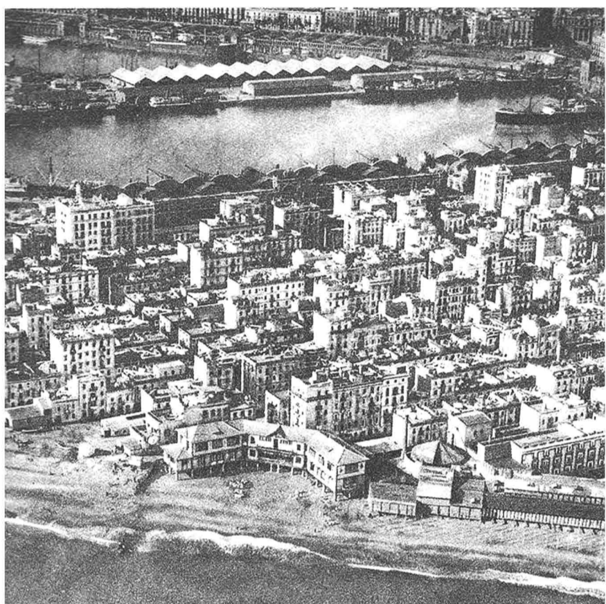
el barri de la barceloneta a cota mar/ escola del mar 1918

eixos basats en una accessibilitat, visuals i programes específics.