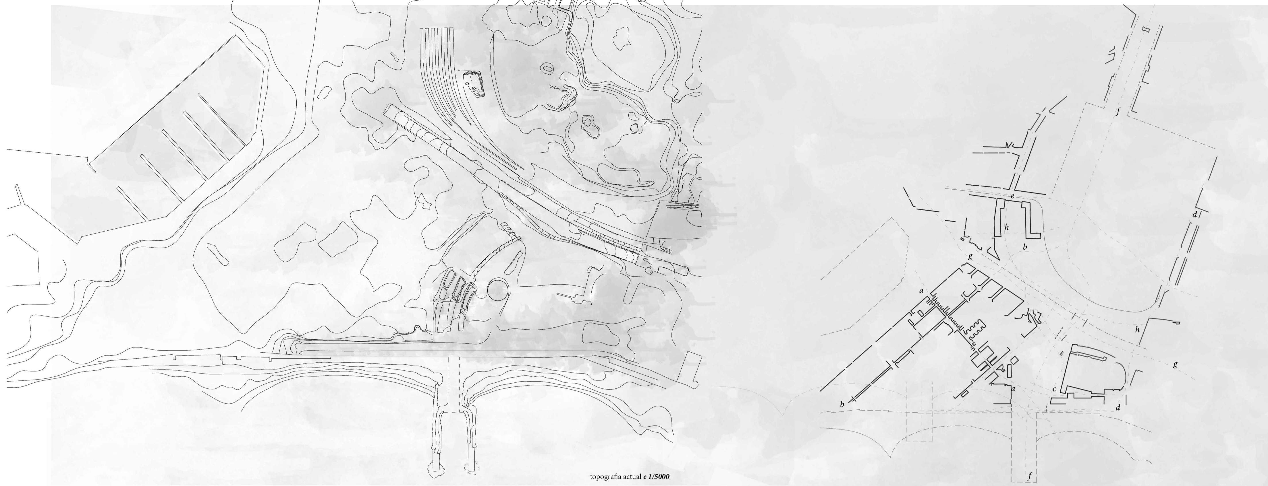
topografia actual e 1/5000