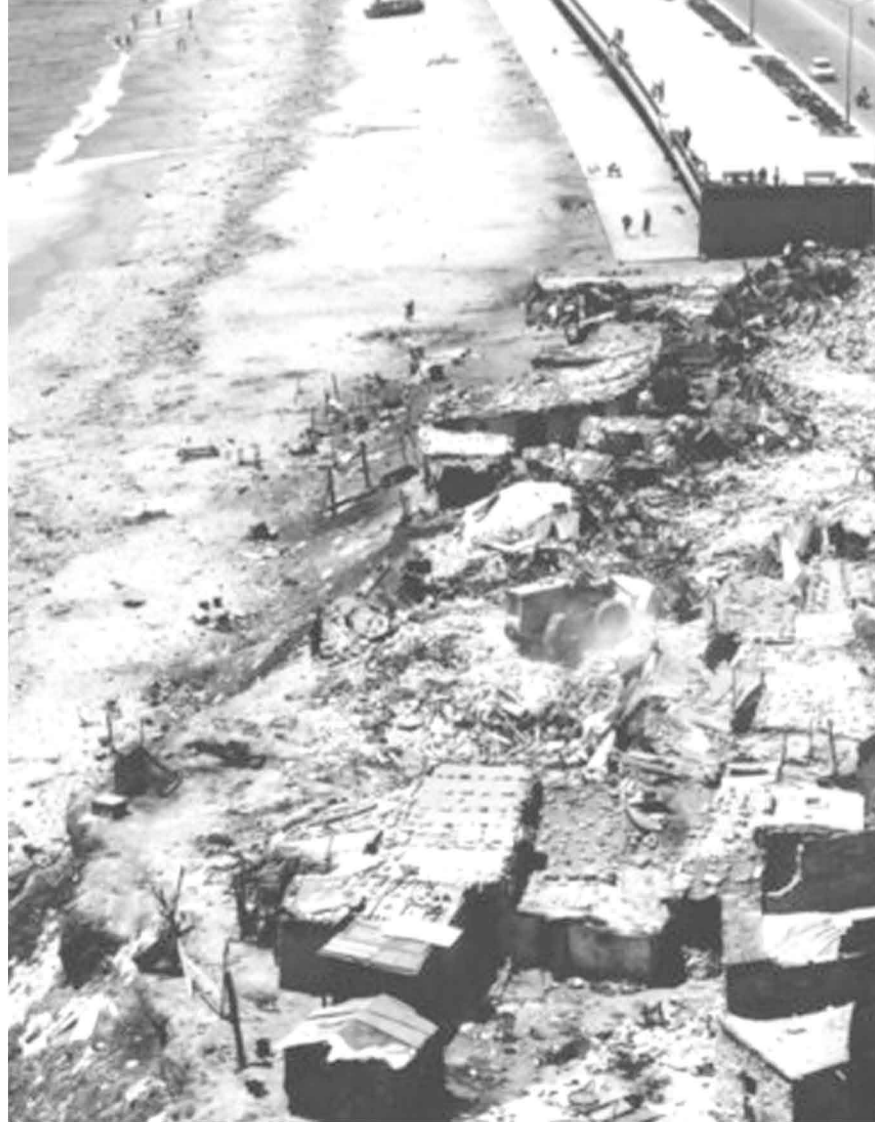
construcció passeig marítim i destrucció barraques del somorrostro, 1960