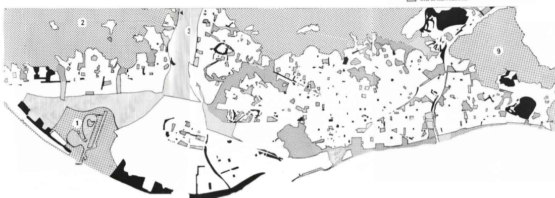
a. espais buits barcelonals / revista cuadernos de arquitectura y de urbanismo n.86-los parques de barcelona