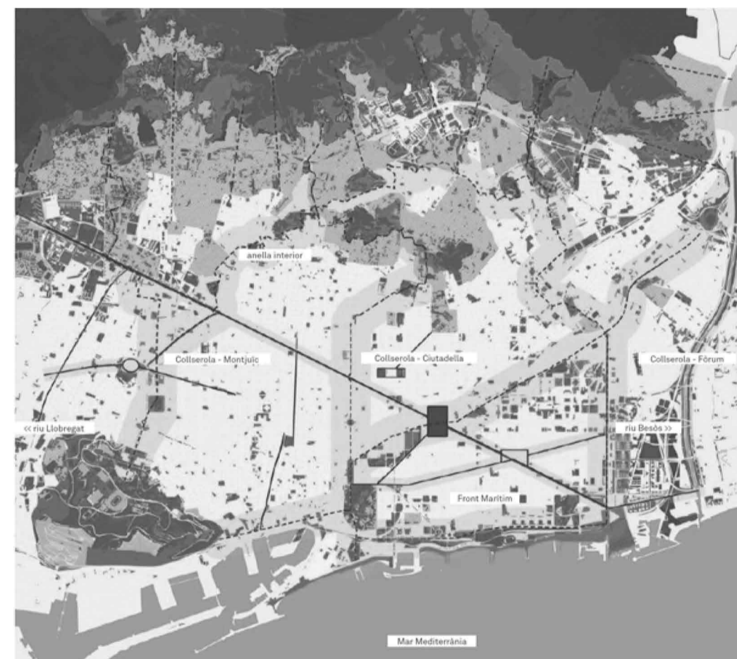
b. les portes de collserola