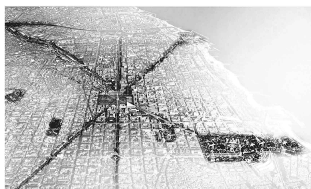
c. proposta ajuntament de barcelona besòs-ciutadella