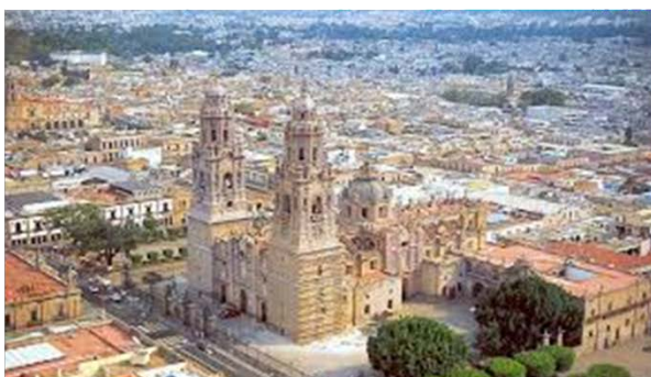
MORELIA MICHOCÁN | 300 km | 597,511 hab.