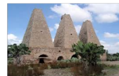
MINERAL DE POZOS | 117 km 2,226 hab.