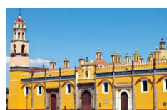
SAN PEDRO CHOLULA | 15 km. 12,459 hab.