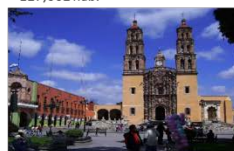
DOLORES HIDALGO | 61 km 134,641 hab.