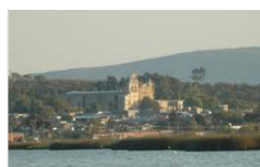
CUITZEO | 33km 28,227 hab.