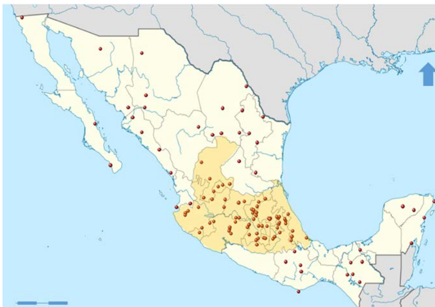
5. Localización de los Pueblos Mágicos 2001-2015 111 Poblaciones distribuidas en el territorio. Elaboración propia

Con el análisis de éstos datos se observa determina lo siguiente, el que la etiqueta Pueblos Mágicos tenga presencia en el 96% del territorio nacional, la concentración de éste programa se identifica principalmente en 13 Estados del País. Con lo cual 19 de los 32 Estados tienen presencia mínima, mostrando en su territorio uno a dos Pueblos Mágicos.