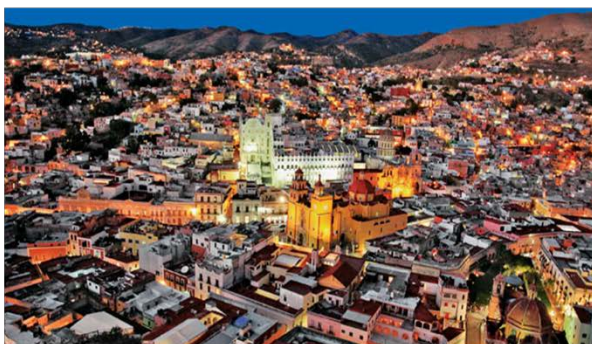
GUANAJUATO, GUANAJUATO | 328 km | 184,239 hab.