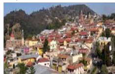
TLALPUJAHUA | 150km 27,587 hab.