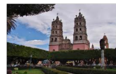
SALVATIERRA | 146 km 97,054 hab.