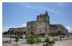
YURIRIA | 124 km 70,782 hab.