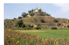
SAN ANDRÉS CHOLULA | 15 km 100,439 hab.