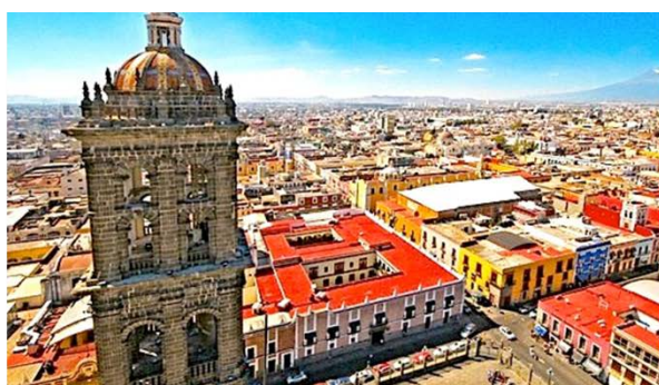
PUEBLA, PUEBLA | 155 km | 1,485,941 hab.

El Patrimonio, la cultura y gastronomía, forman parte de la identidad de los Pueblos Mágicos, en el desarrollo de la investigación se argumentará si éstas características forman parte del encanto de éstas poblaciones.