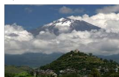
ATLIXCO | 31 km 127,062 hab.