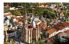
ANGANGUEO | 153km 10,768 hab.