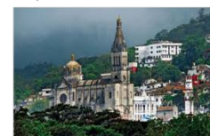
CUETZALAN | 176 km. 47,433 hab.