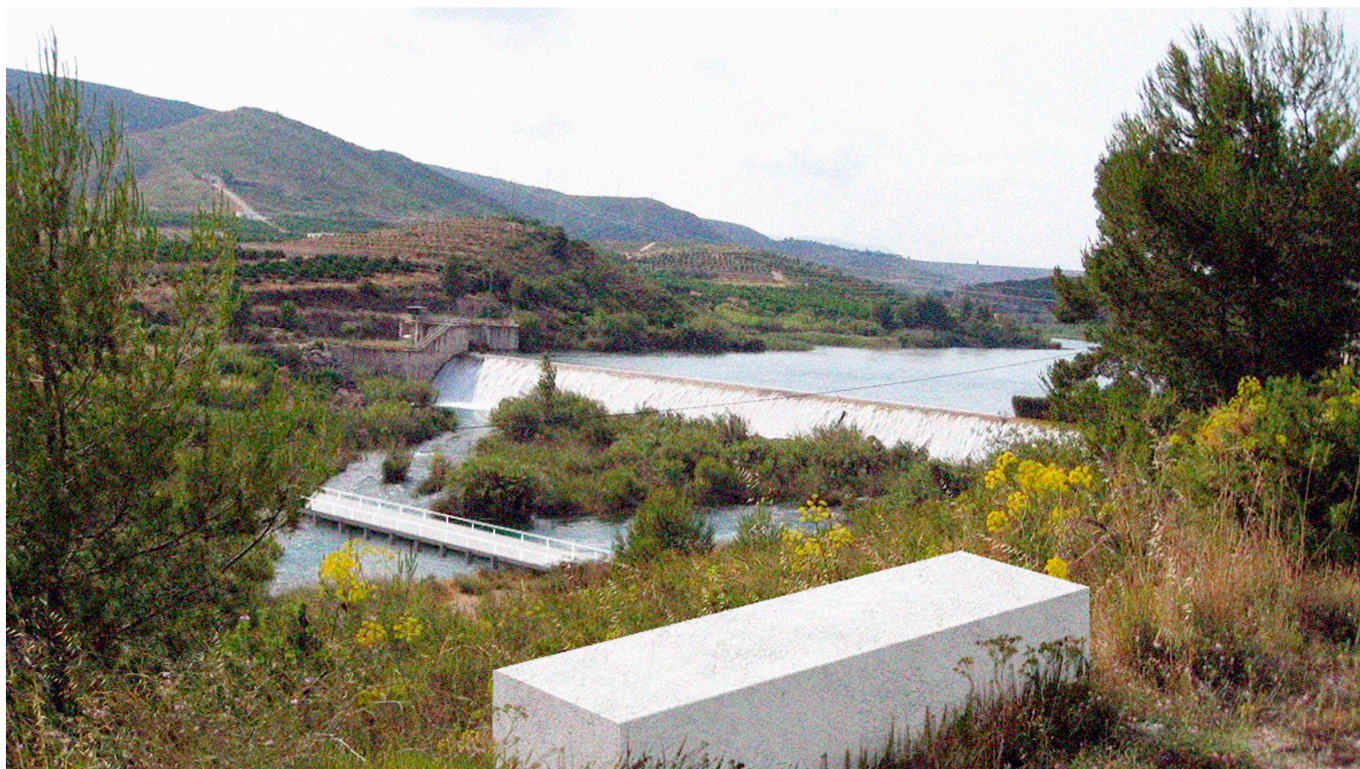
Recreació d'un punt d'interacció entre la infraestructura verda i la nova xarxa "slow"