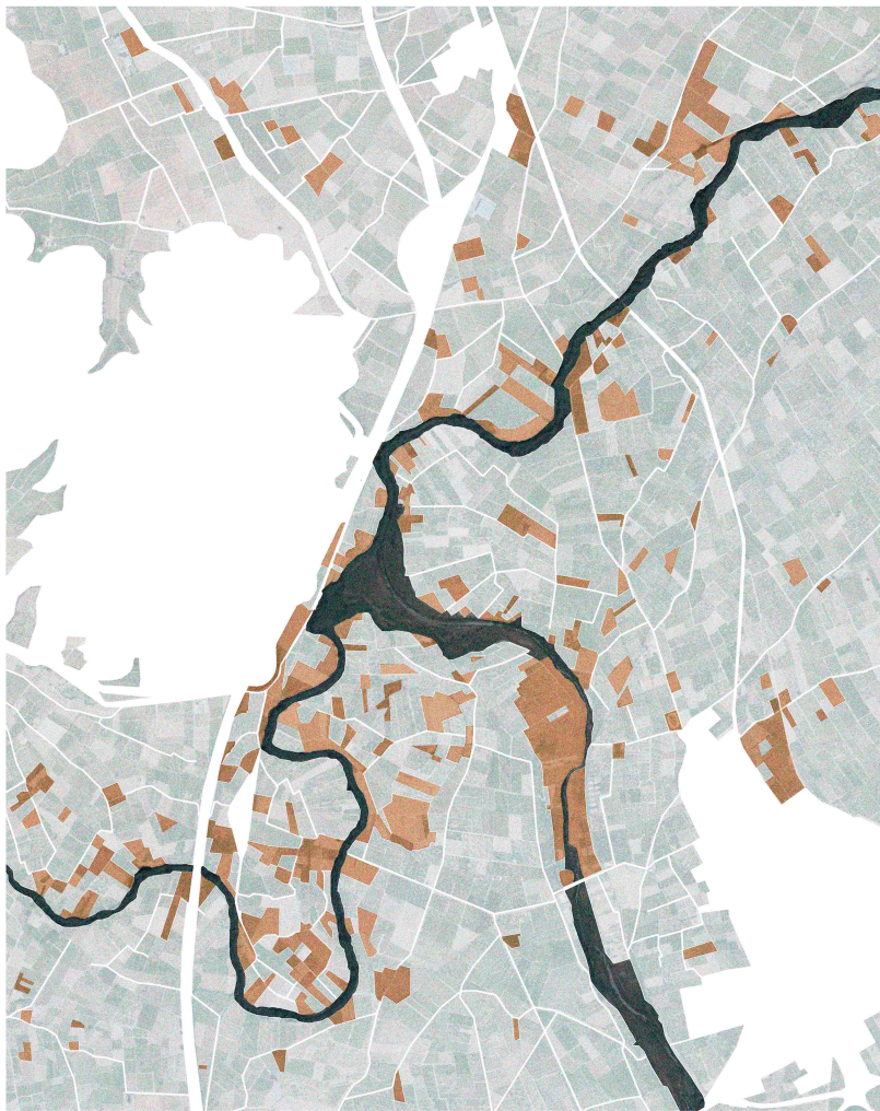
Parcel·les agrícoles abandonades a la zona del trencall

El cultiu del caqui ha tingut una expansió exponencial durant els últims anys convertint-se en la segona producció a la Vall de Càrcer. L'augment de l'oferta a comportat a la disminució radical del seu valor en els circuits comercials convencionals.