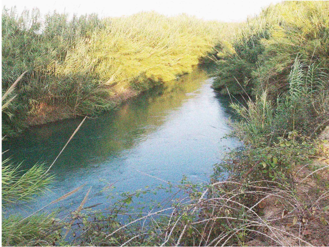
RIU XÚQUER, 2016