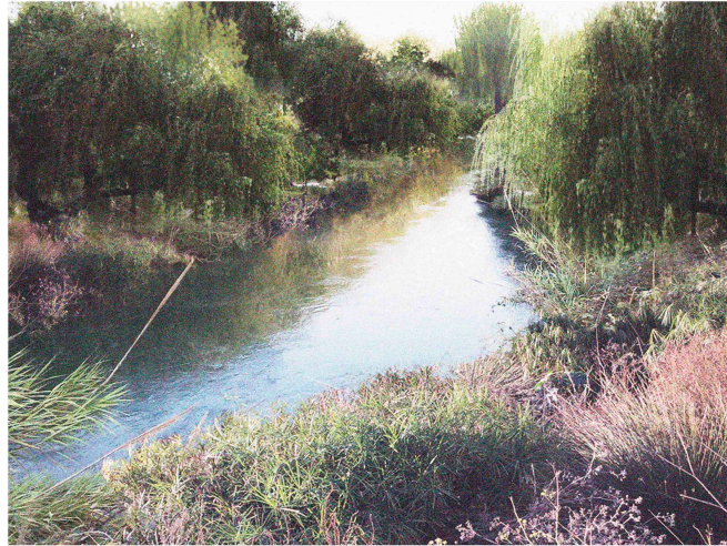
RIU XÚQUER, 2046