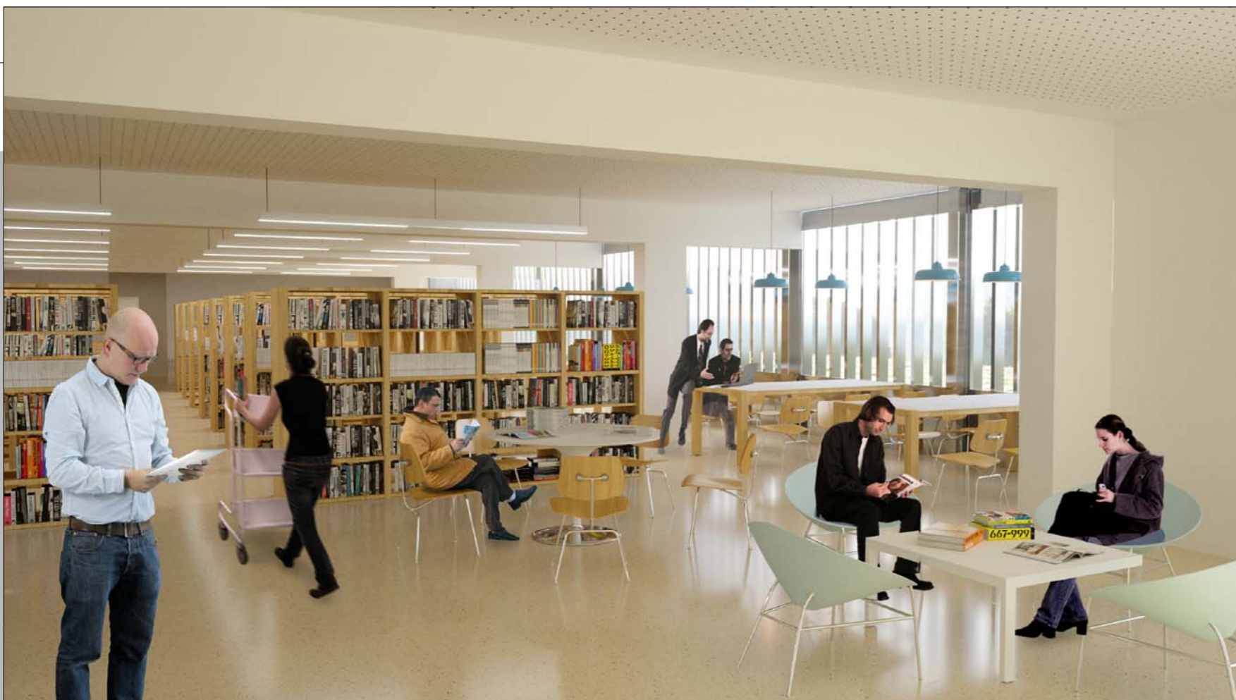
BIBLIOTECA. ÀREA DE FONTS GENERAL