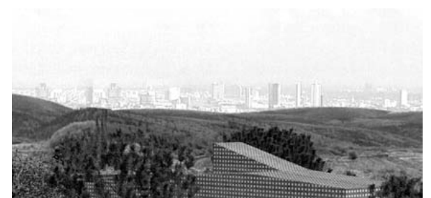
NIVEL 3. CASA VERDE. POZUELO. MADRID. A&H.