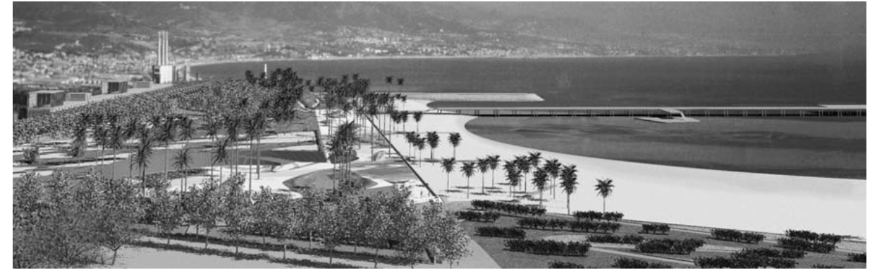
PARC LITORAL. FÒRUM 2004. BARCELONA 2002-2004.