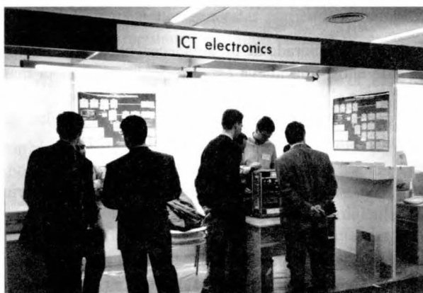
Stands de empresas.