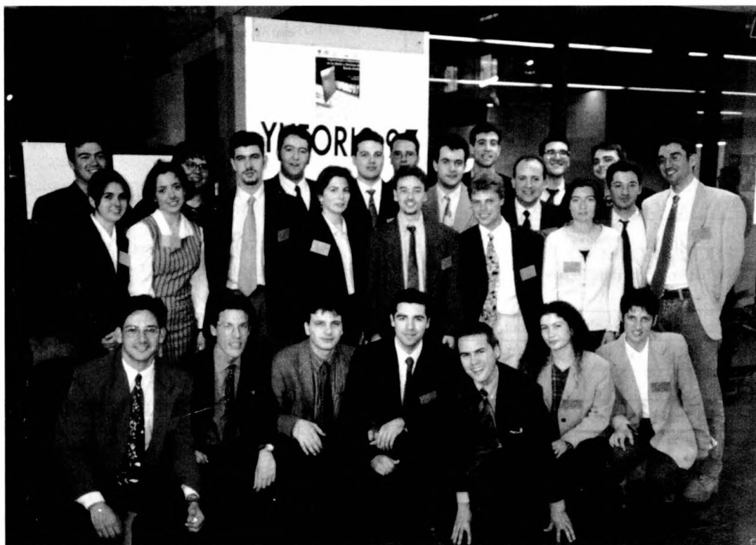
Rama de Estudiantes del IEEE de Barcelona.

Asimismo, la relación con las empresas se ha intensificado respecto a otras ediciones. Éstas han pasado a colaborar activamente tanto en el apartado económico como en el tecnológico, aportando equipos para realizar demostraciones y personal experimentado para dar diversas conferencias y ponencias. Como consecuencia de lo anterior, y del hecho que Barcelona pertenece a una