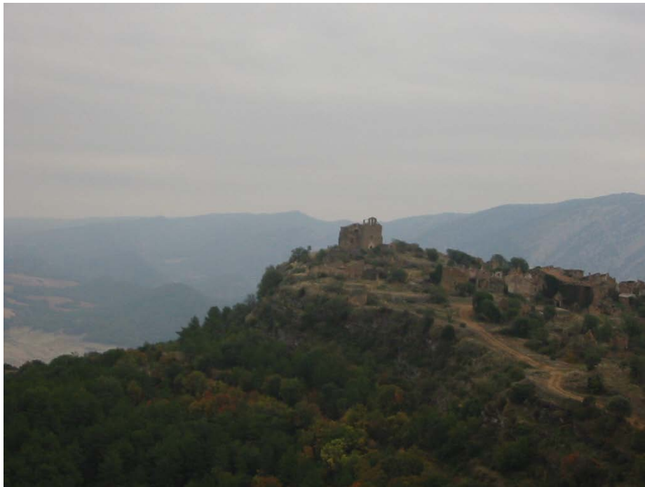
El pueblo de Fet, sobre un acantilado

impresionante acantilado (en donde se encuentra el pueblo), que se yergue sobre el embalse de Canelles.