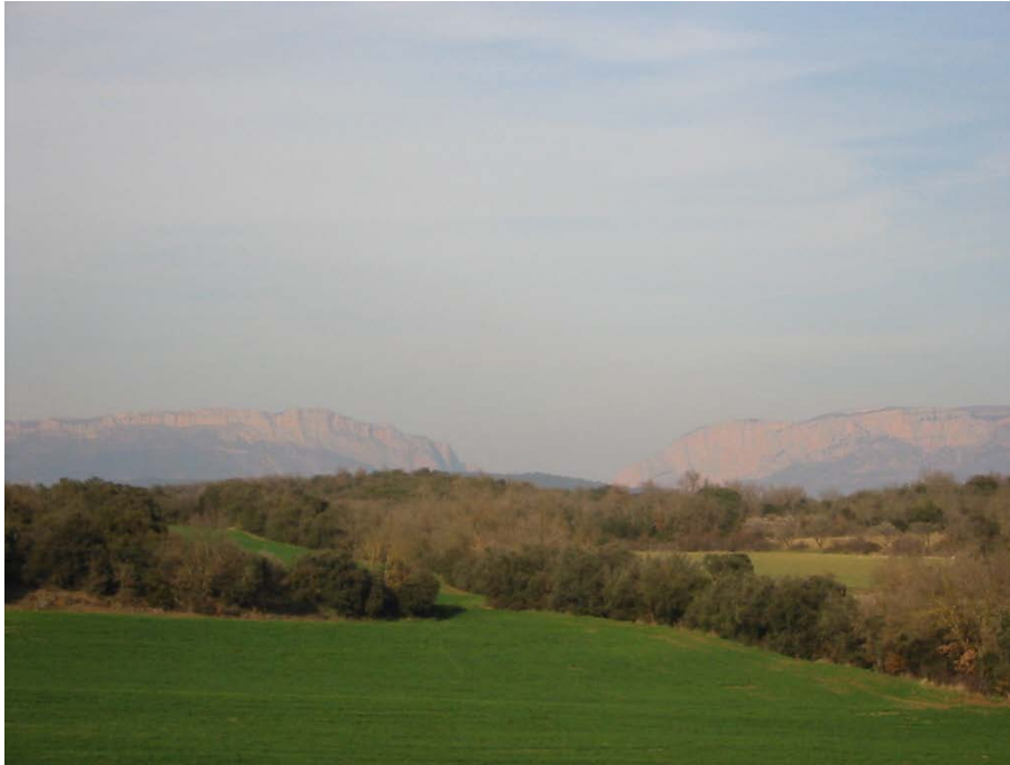
El Congosto de Bon Rebei (o Pas de Bon Rebei ), desde las inmediaciones del Vértice Geodésico de la Creu (la Cruz)

Central Surpirenaica , en donde nos hallamos y nos hallaremos a lo largo de todo el recorrido de este itinerario.