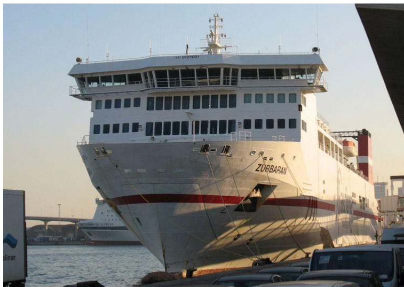
Imatge del Ro/Pax “Zurbarán” d’Acciona-Trasmediterranea, com exemple de vaixell de transbord rodat amb capacitat per a passatgers, en el port de Barcelona. Font www.merchantships.info .

És per això que el balanç d'emissions del transport per carretera, és menys positiu que en el cas del transport marítim. Entenent així el declarat suport administratiu a les cadenes de transport intermodals, amb trams marítics basats en el transport marítim de curta distància, com a forma d’aconseguir la major sostenibilitat de les accions de mobilitat dins d’Europa. Hem de considerar addicionalment, els costos derivats de la congestió, accidentabilitat i soroll, en tots aquests casos el transport marítim incorre en una taxa menor en tots ells i és per això, que es considera la millor alternativa 8 .