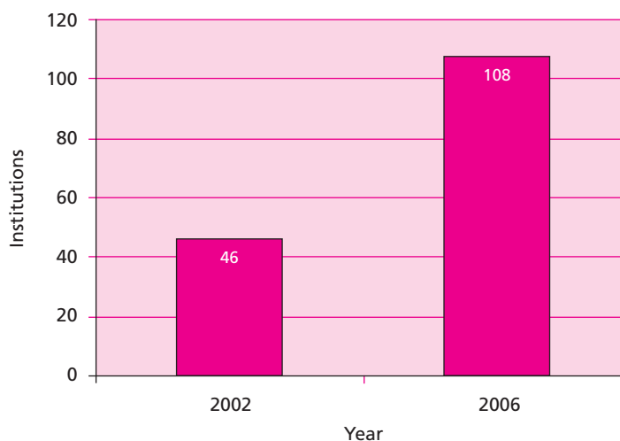
FIGURA 2. Número de instituciones de educación superior con programas acreditados (2002-2006)