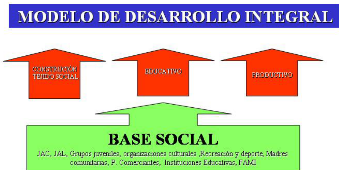
Figura 2 Ejes estructurantes del Proyecto Ciudadela Educativa

JAC: Juntas de Acción Comunal. JAL: Juntas de Administradoras Locales. FAMI: Programa de Atención a la Familia la Mujer y el Infante.