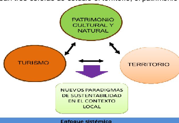
Imagen 1. Esquema de abordaje metodológico.

El concepto de patrimonio cultural de acuerdo con García López (2008), surge de la relación a dos funciones claras de carácter social y político: cohesión social e identidad social. A estas funciones se añade posteriormente un abierto carácter económico, al convertirse en un bien de consumo demandado por el turismo. Para el abordaje metodológico se ha contemplado el enfoque de sistemas, el cual permite abordar el problema de la identificación del patrimonio cultural basada en la noción de totalidad y sus componentes (Guerrero, 2011). Por tanto se plantean tres esferas de estudio el territorio, el patrimonio cultural y el turismo.