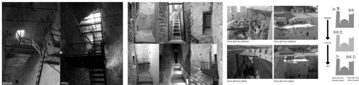
Figura 4. Torre del Corn y Torre del Fum. Imágenes de antes y después de la intervención.

Con la rehabilitación de la cubierta de la Torre del Fum se recupera su función medieval original que consistía en la vigilancia de la bahía, de ahí su nombre, torre del “humo”, es decir, lugar para comunicarse con los ciudadanos mediante señales visuales.