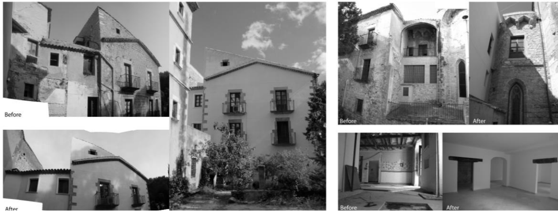
Figura 3. Palau de l'Abat. Imágenes de antes y después de la intervención.

Por otro lado, al descubrir la cubierta inclinada apoyada en el muro de la iglesia, apareció una cubierta plana anterior, que ha sido adaptada para su uso como terraza desde donde se puede observar el puerto y el horizonte marítimo. Estos descubrimientos supusieron una modificación del proyecto presentado que, sin embargo, mejoraron y ampliaron el recorrido museístico.