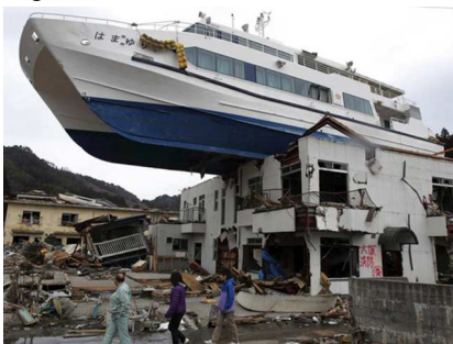
Figura 6 – Tsunami nella città di Otuchi, Prefettura di Iwate. Giappone, 2011