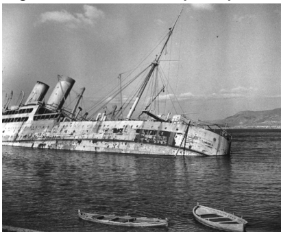
Figura 4 – Phil Stern (1919). Transatlantico italiano affondato nel porto di Messina , 1943.