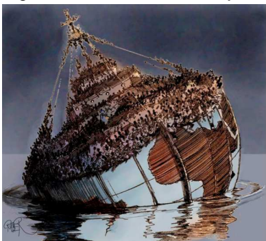
Figura 3 – Riber Hansson (1939). Ship Earth , 2012