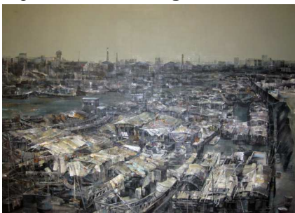
Figura 12 – Luo Ling, Liu Ke. “Shunde Venice project”. Venezia, 2013