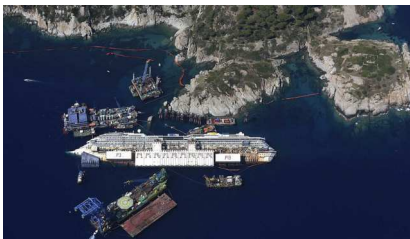
Figura 5 – Costa Concordia all'isola del Giglio. Italia, 2013