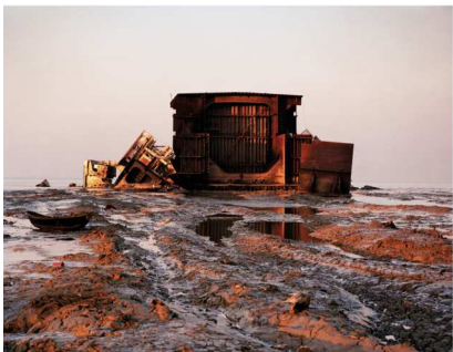
Figura 10 – Pezzi di nave su paesaggi instabili a Chittagong, Bangladesh