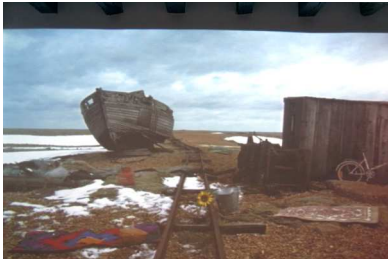
Figura 2 – Aza Shade (1988). The Disappearing City . Venezia, 2013