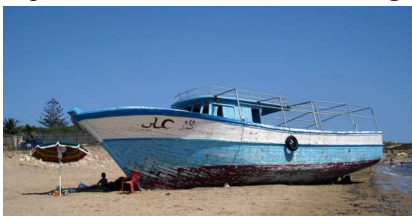
Figura 7 – Imbarcazione dei migranti spiaggiata sulle coste di Ragusa. Italia, 2010