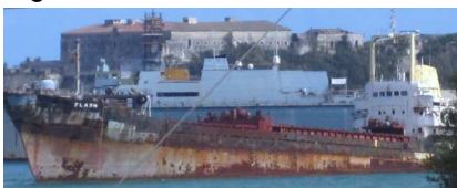
Figura 8 – Relitto e sullo sfondo il castello federiciano nel porto di Augusta. Italia 2012