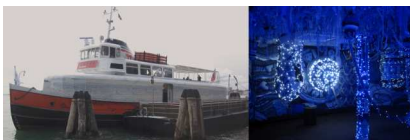
Figura 11 – Joana Vasconcelos. “Trafaria praia”. Venezia, 2013

L'esplorazione di una breve fenomenologia a partire da ciò che resta implica l'attivazione di un nuovo ciclo di vita. Infatti, il riconoscimento del fragile stato di quei particolari ambiti terrestri ed acquatici, vitali e limitati, è fondamentale per la loro sopravvivenza e contemporaneamente preludio per nuovi stadi evolutivi degli stessi paesaggi contaminati. I luoghi ibridati possono essere interpretati come occasioni per rifondare un rinnovato dialogo fra uomo e natura. In quest'accezione, il concetto di riciclo è declinato come parola-chiave attraverso cui sperimentare strategie e strumenti di rigenerazione in geografie territoriali preesistenti coinvolte in processi di emarginazione e di rifiuto. Per dare contezza di ciò, si riportano due esempi. Il primo è il progetto di trasformazione funzionante di un iconico traghetto di Lisbona a padiglione galleggiante (Figura 11). Il secondo riguarda un'azione culturale di rinnovamento di un'ampia zona del fiume De Sterg in luogo di produzione artistica (Figura 12). In entrambi i casi, si affida all'arte la prima possibilità attraverso cui sperimentare quel fondante processo formativo dalla natura all'uomo e viceversa.