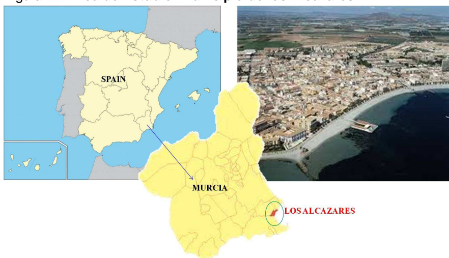
Figura 4 – Área de Estudio: Municipio de los Alcázares