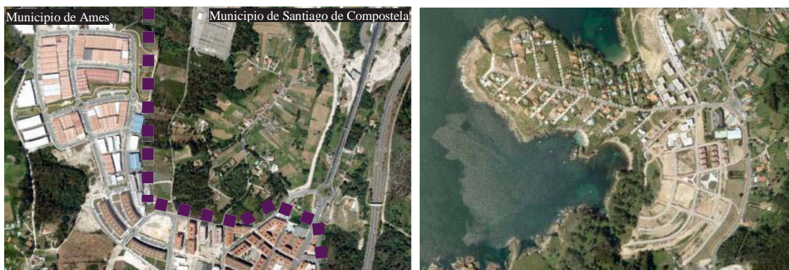
Figura 1: Expansión urbana en el borde municipal de Santiago de Compostela y Figura 2: Ejemplo del irracional consumo de suelo en el litoral; Oleiros, área urbana de A Coruña.

Las ciudades y los territorios inteligentes – Smart Cities, Smart Places [5]- diluyen las fronteras físicas, administrativas y de comunicación. Pero la realidad es otra, la intención de adquirir y consolidar nuevas dinámicas para la ciudad difusa en Galicia se ve marcada por estas pequeñas cicatrices –en su origen fracturas- que reclaman la máxima atención de la ordenación del territorio. Hay muestras suficientes de las limitaciones que el planeamiento urbanístico tiene en la región para prever y anteponerse a los conflictos de intereses y de usos del suelo. El papel de las Directrices de Ordenación del Territorio de Galicia -aprobadas provisionalmente en febrero de 2011- y los futuros Gobiernos –tanto locales como regionales-, es dar mayor protagonismo a los actores públicos y privados, plantear nuevas estrategias y retos desde la realidad local y urbana, e integrar políticas sectoriales que fomenten sinergias y forjen la cohesión territorial.