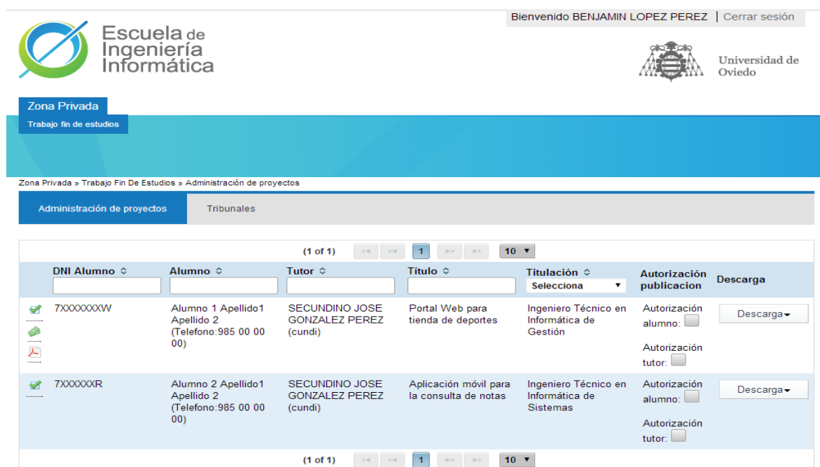
Figura 3: Captura de la aplicación