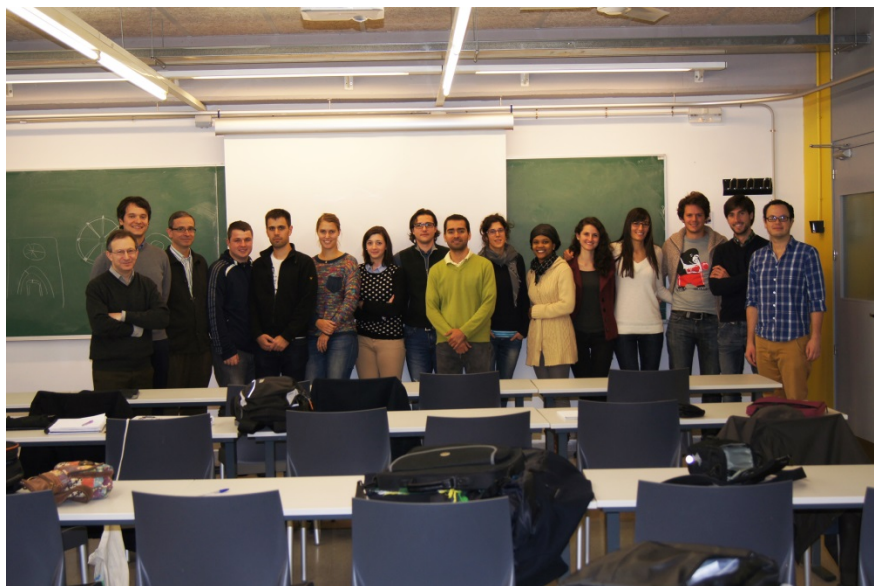
Professors i estudiants després del taller (any acadèmic 2013-2014)