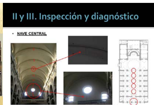
Exemples de parts de presentacions dels treballs de grup