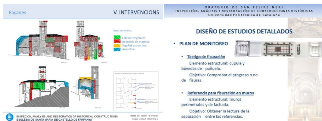
Exemples de parts de presentacions dels treballs de grup

Plataforma virtual RIMA, espai corresponent al Grup d'Interès d'Aprenentatge Cooperatiu (GIAC): https://www.upc.edu/rima/grups/giac .