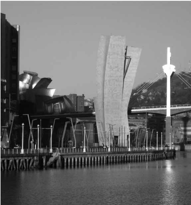
Fig. 1. Ría de Bilbao, al fondo el Museo Guggenheim, Frank Gehry.