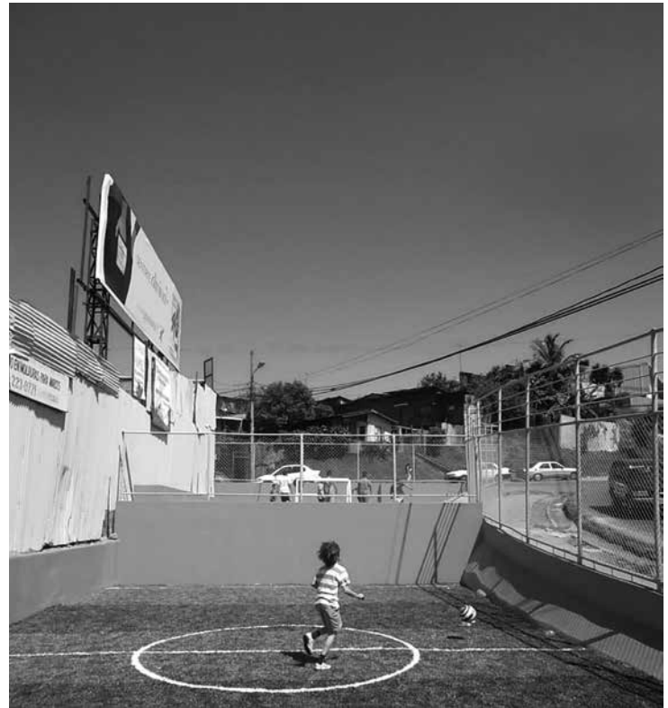
Fig. 6. Microcanchas Pochote, Luis Diego Barahona