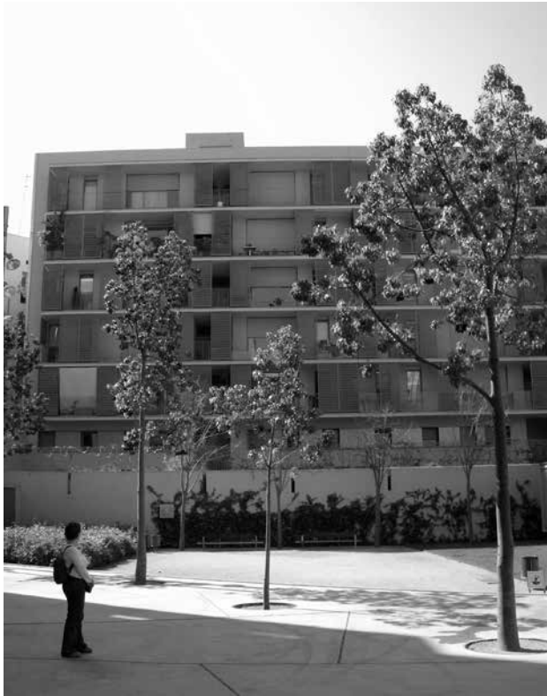
Fig. 5. Viviendas en el Ensanche, Carlos Ferrater.