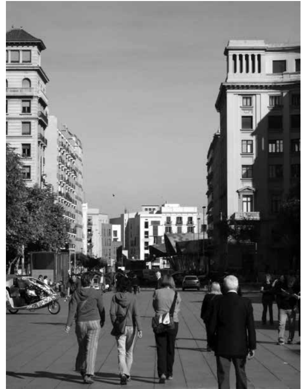
Fig. 2. Barri Santa Caterina.