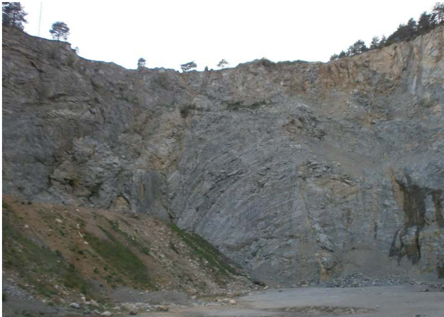
Fotografia 14. Front d'exploració de la pedrera