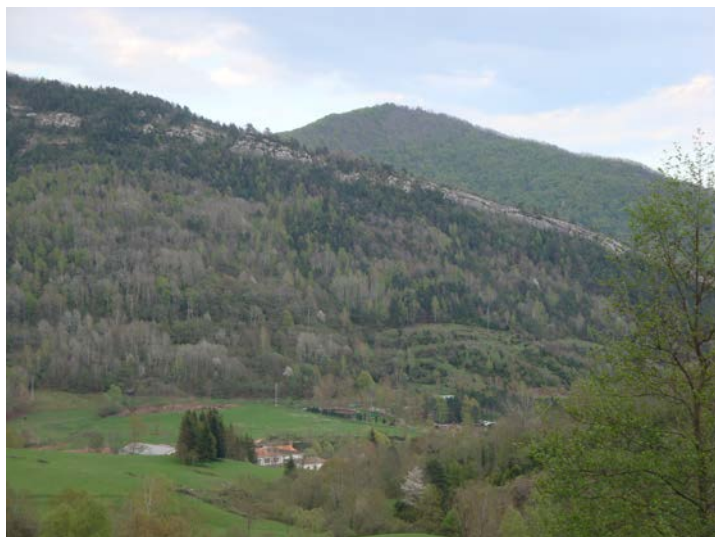
Fotografia 5. Puig de Dot. Colònia Estevenell