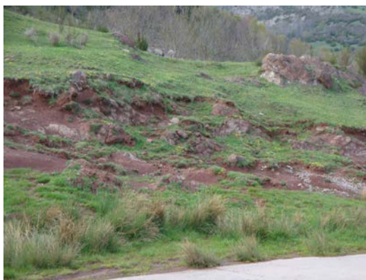
Fotografia 9. Afloraments del Permotriès, en el Coll de la Creu

Després de fer l'aturada anterior, cal continuar cap a ponent pel camí que ens va apropant a Surroca i a Ogassa. En arribar al Coll de la Creu , podem fer una nova aturada, si s'escau, a poc més de 1km de la parada anterior.