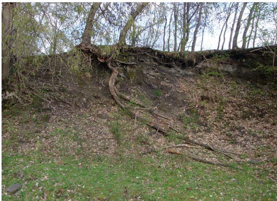
Fotografia 11. Antiga escombrera del camí de la mina de Sant Martí de Surroca

En aquest indret, hi ha les restes d'una antiga explotació dels nivells carbonosos de la Conca de Surroca-Ogassa . Tot i així, el fet més interessant, és l'abundant presència de restes de falgueres fòssils, situades entre els nivells esquistosos del Carbonífer. Però, tot i l'abundor d'aquests fòssils vegetals, recomanem veure'ls, sense arrancar-los