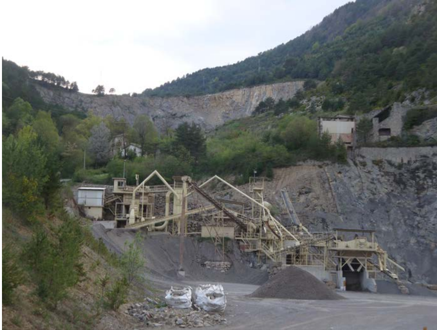
Fotografia13. Instal·lacions de la pedrera