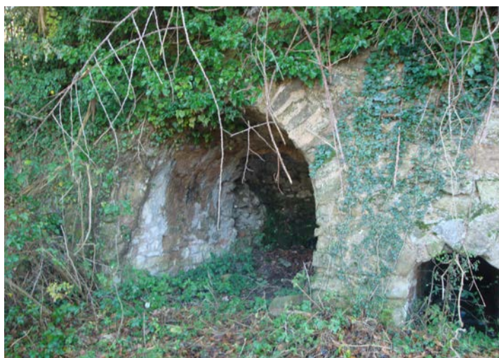
Fotografia 2. Un aspecte del Forn de Guix

Després de fer l'aturada anterior, cal retornar a la carretera C- 26 / N – 260. En arribar a la cruïlla de la carretera a Olot, ens caldrà seguir cap a Sant Pau de Segúries. Poc després de la cruïlla trobarem el camí de Santa Maria de Parella . Després, des del primer revolt haurem de seguir a peu. En arribar a les mines farem una nova aturada, a uns 4 Km de l'anterior.