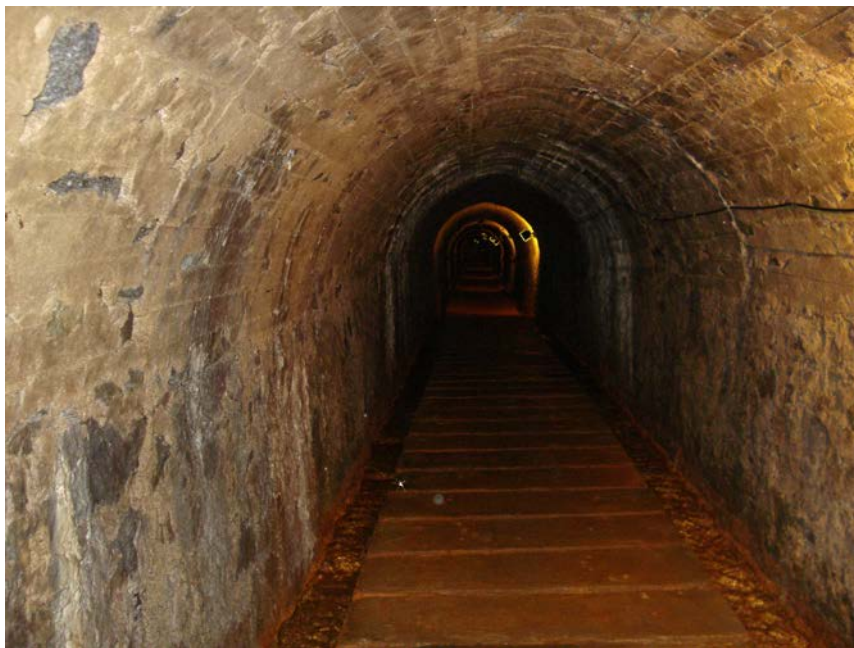
Fotografia 11. Interior de la galeria musealitzada

Per d'altra banda, cal dir que actualment, a moltes de les escombreres poden trobar-se mostres de: MARCASSITA, PIRITA, GOETHITA (limonítica i terrosa) i MELANTERITA, entre altres minerals. Tanmateix apareixen altres minerals com GUIX i CALCITA, sovint força abundants. També, gaudeixen de reconegut coneixement, les restes de falgueres fòssils que es troben entre els nivells d'hulla. Hi ha un indret, prop del poble, on hi ha forà restes d'aquests vegetals: a la bora del recorregut de l'antic ferrocarril.