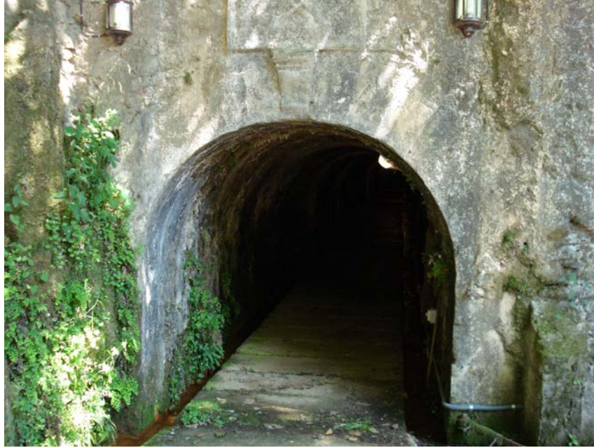
Fotografia 12. Boca mina. Mina Dolça