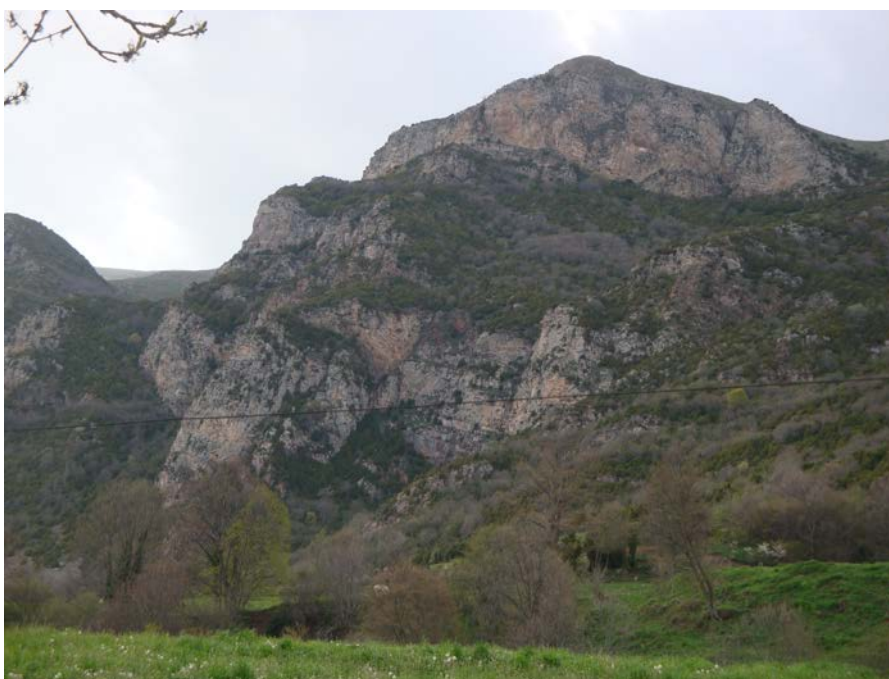
Fotografia 10. La Pedra dels Tres Bisbats

Per d'altra banda, mirant cap el Nord, es poden veure els relleus carbonatats del Padró dels tres Batlles . Es tracta d'una mola carbonatada, del Devonià, situada al Nord de l' Encavalcament de Ribes de Fresser – Setcases – Camprodon . (fotografia 10).