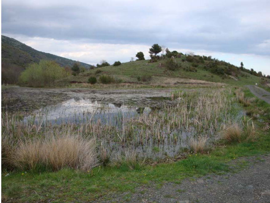
Fotografia 7. Aiguamolls del Pla d'en Plata, terme de Camprodon