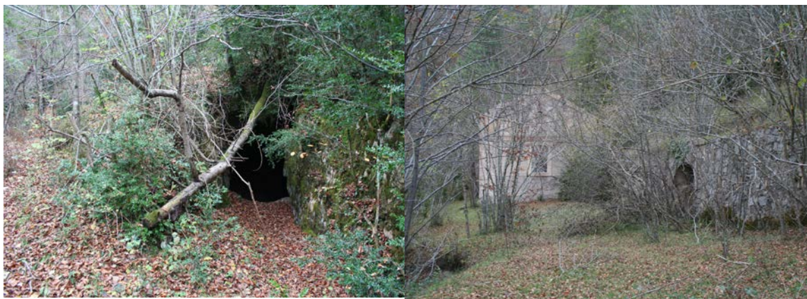
Fotografia 3. Una de les bocamines