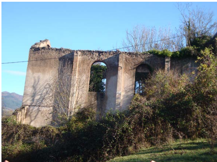
Fotografia 1. Un aspecte de l'antiga guixera

Aquests materials són també els que apareixen a l'indret de l'aturada, on afloren uns nivells de guixos, els quals pertanyen a la Formació Campdevànol. En efecte, aquí hi ha un aflorament dels nivells de guixos, els quals pertanyen a la. Aquests han estat explotats, per tal de dedicar-los a una antiga guixera. (fotografia 1).