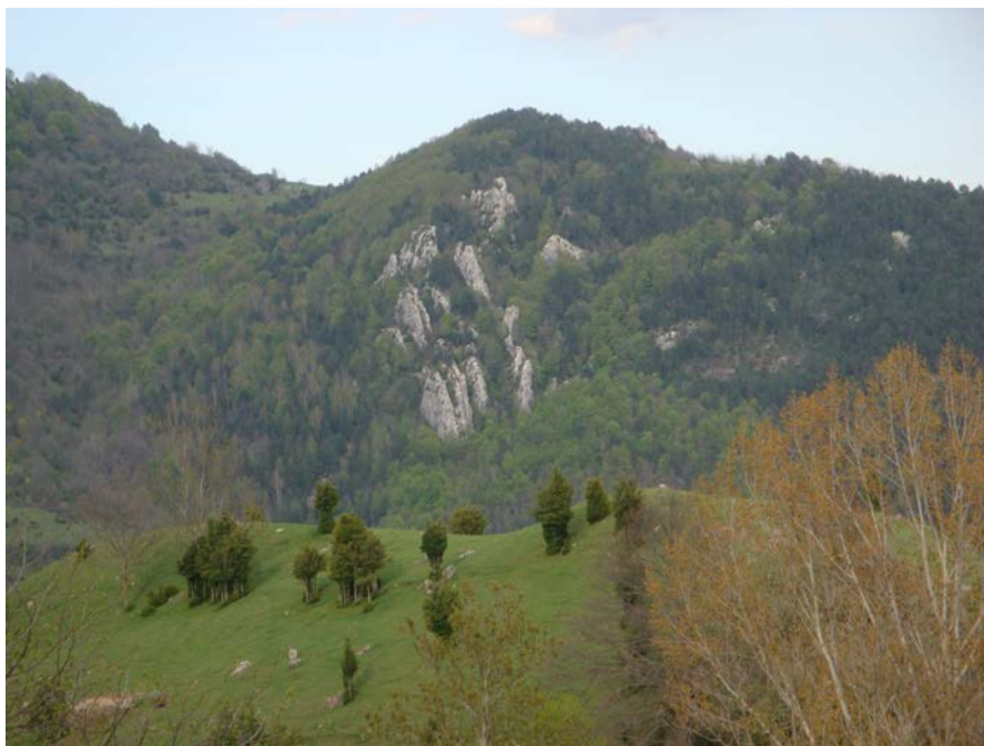
Fotografia 6. Els Costeletets. Colònia Estevenell