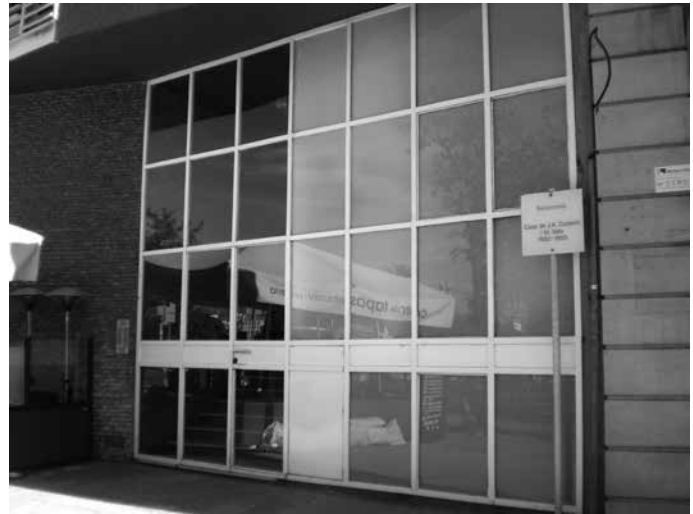
Señalización exterior de las viviendas de Coderch en Passeig Joan de Borbó. La información es mínima (autores y año) y la placa ni tan solo tiene firma de la institución que la colocó.