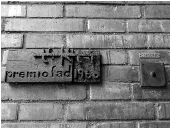
Placa del FAD, diseñada por Subirachs, en el edificio de Coderch en la calle Juan Sebastian Bach.