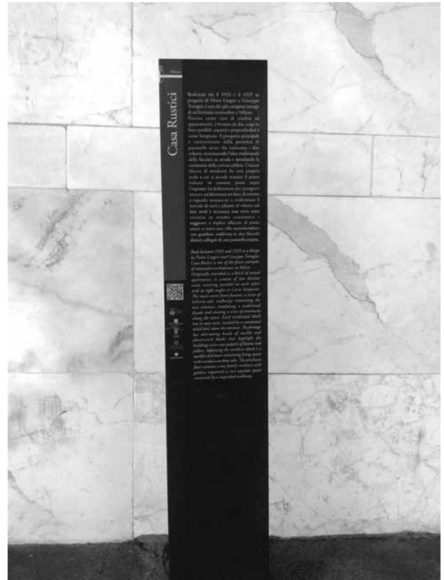
Emplazamiento y contenido de la placa ante la Casa Rustici, en Milán. Además de la identificación e historia, un código QR da acceso a una web. Se identifican todos los actores que han participado.