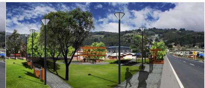
DESPUÉS: Plaza Acceso a Tirúa