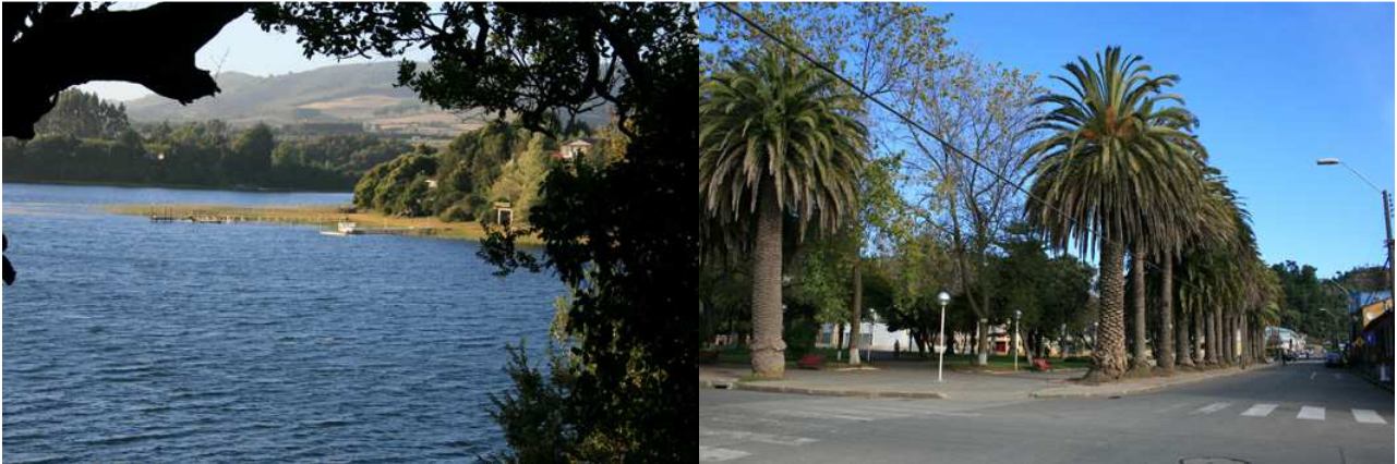
El paisaje en la Provincia de Arauco: Lago Lanalhue y Plaza de Lebu (De Souza, 2012)