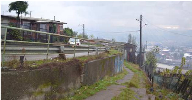
AHORA: Viviendas en los cerros de Curanilahue