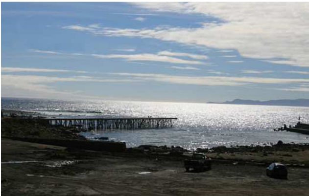
AHORA: Costanera de Lebu