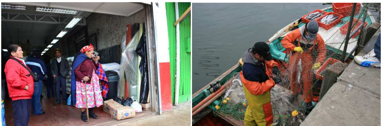
Patrimonio etnográfico: cultura mapuche y pueblo de pescadores (De Souza, 2012)

En la actualidad otro grupo social de relevancia en la Provincia de Arauco es el de los pescadores. Las denominadas "caletas pesqueras", presentes en todo el litoral provincial, son los espacios de vida y trabajo de estas comunidades. Las mismas, tienen su mayor expresión en Tirúa y Lebu, cuyas costaneras de atraque de embarcaciones son, no solo espacios del trabajo pesquero en tierra, sino también importantes puntos de encuentro, vida social y paseo público.