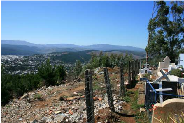
AHORA: Cementerio de Curanilahue