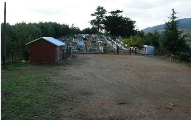
AHORA: Cementerio de Contulmo