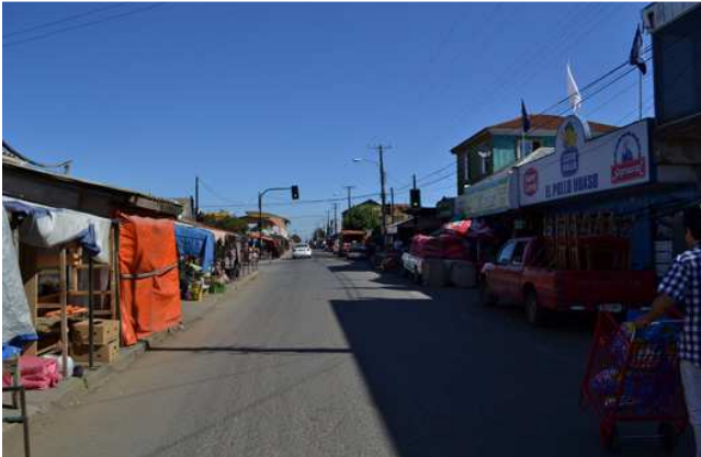
AHORA: Feria libre, Cañete Elaboración propia