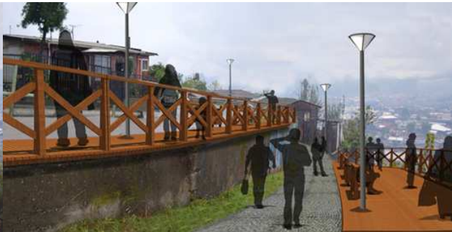
DESPUÉS: Red de miradores en los cerros de Curanilahue