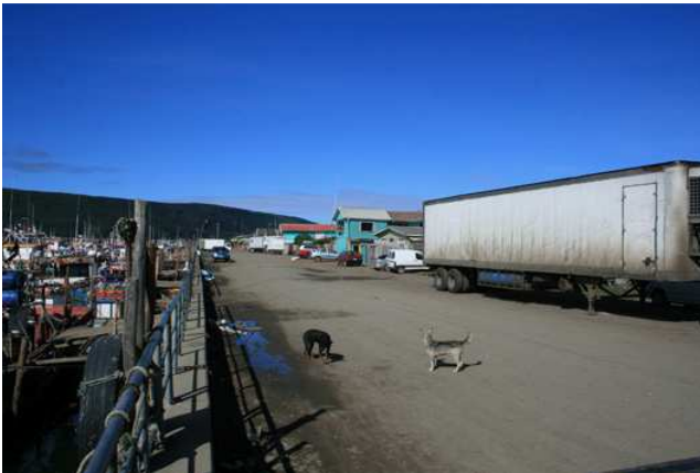
AHORA: Costanera de Lebu