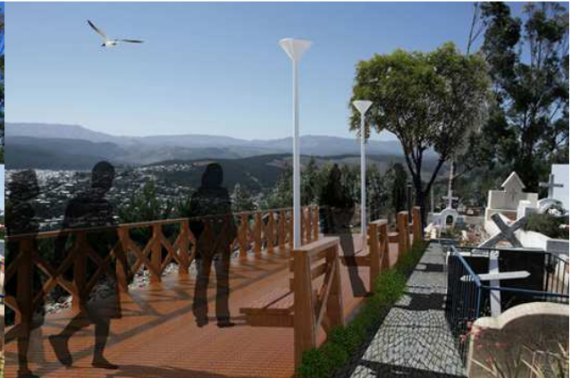
DESPUÉS: Mirador Cementerio de Curanilahue