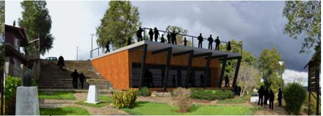
DESPUÉS: Centro de Interpretación, mirador Fuerte Tucapel