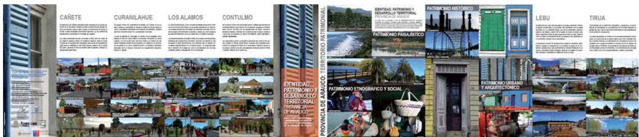
Guía Patrimonial de la Provincia de Arauco Elaboración propia

El formato adoptado fue un desplegable de 8 cuerpos transformable en un afiche, a color, en papel couché grueso con un tiraje de 10.000 ejemplares. El número de ejemplares impresos resulta aquí significativo, porque permitió la amplia difusión del proyecto en las 6 comunidades involucradas, llevando información destinada a reforzar los valores patrimoniales de cada poblado. Expresamente el equipo se alejó de la idea de editar una guía costosa en pocos ejemplares y utilizando los mismos recursos se amplió la cobertura a través de un formato más asequible a los jóvenes y la comunidad en general. Detrás de esta propuesta, está la idea de la educación patrimonial, en la perspectiva de desterrar la antigua concepción que el patrimonio es solo aquella arquitectura monumental y un asunto de expertos.