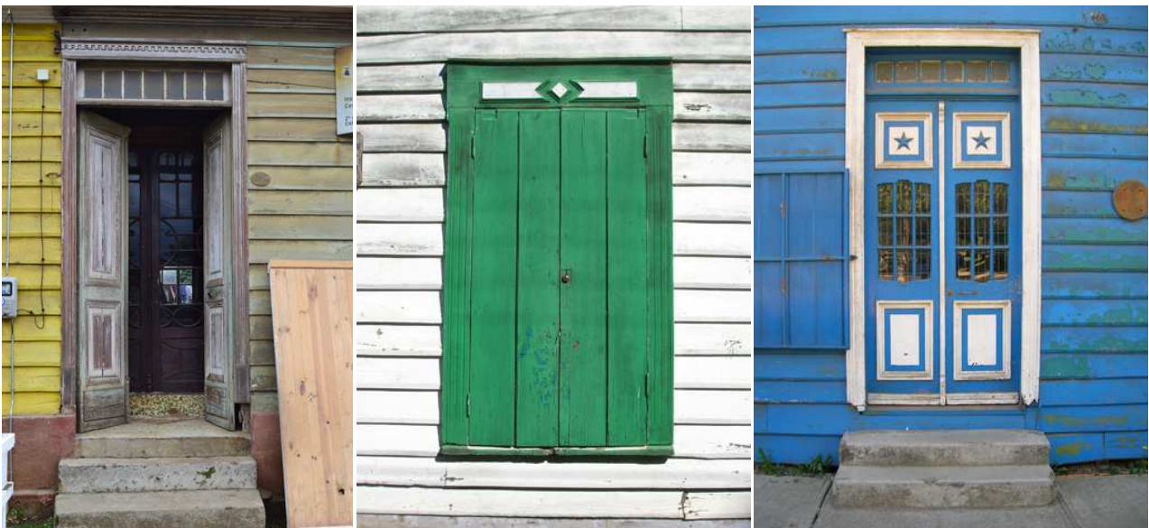
Patrimonio arquitectónico en madera en la Provincia de Arauco (Fuentes, 2012)

Las viviendas disponen de una serie de recintos con los que se regula la relación del interior con el exterior. Este encuentro nunca es abrupto, desarrollándose una serie de espacios intermedios, algunos de los cuales aparecen simultáneamente en una casa. La exclusiva o "chiflonera" es uno de ellos. Se trata de un pequeño recinto de doble puerta ubicado en el ingreso, que tiene por objeto impedir la entrada del viento al interior de la vivienda y por consiguiente lograr un espacio de amortiguación de las inclemencias externas. La exclusiva suele acusarse como volumen y solo en esto reside su diferencia con el "porche" o mampara, recinto en el acceso incorporado al volumen de la casa que tiene idéntico objetivo.