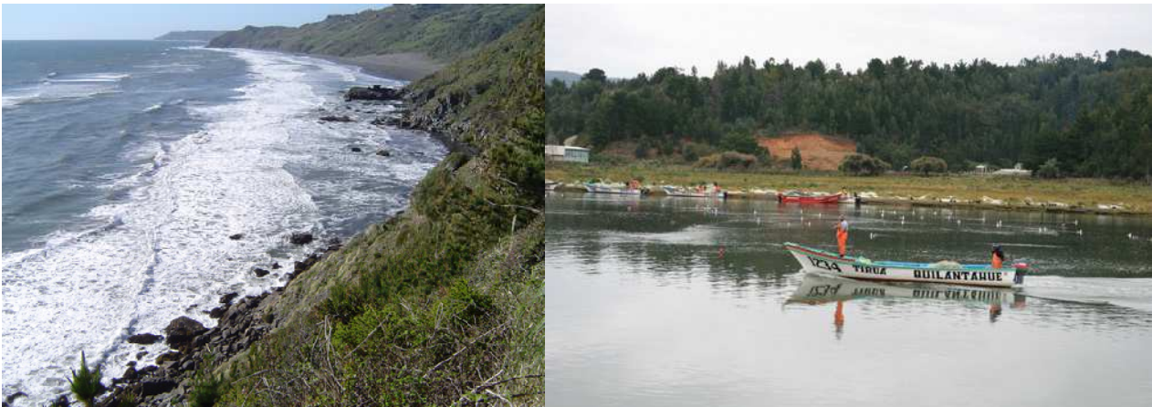
El paisaje en la Provincia de Arauco, Chile: ríos y mar (Cerde, 2012)

Otros de los elementos que caracterizan el paisaje natural de la Provincia de Arauco son sus bosques. Pero surge aquí una contradicción, ya que estamos en presencia de un conflicto entre la explotación forestal a través de especies recientemente introducidas como pino, eucalipto y la eliminación de una flora nativa ancestral de excepcional valor y belleza, como robles, luma, alerces y una innumerable cantidad de otras especies arbóreas, auténtico patrimonio natural de la zona.