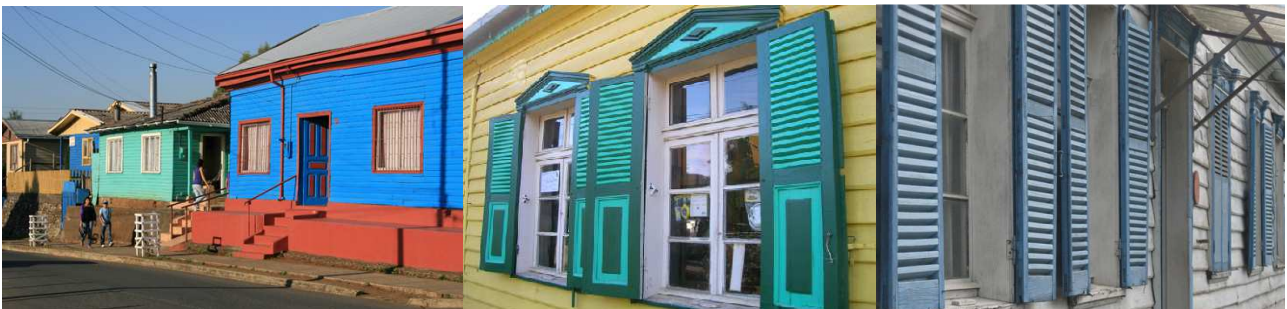
Patrimonio arquitectónico en madera en la Provincia de Arauco (Fuentes, 2012)

Cuando se trata de viviendas de emplazamiento pareado o adosado, la idea de continuidad se acentúa aún más. Por lo general, este tipo de emplazamiento se encuentra conviviendo con comercios o incluso incorporando un local comercial en su programa.