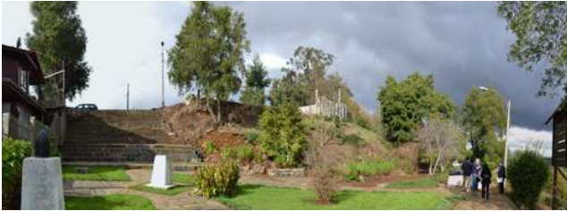
AHORA: Fuerte Tucapel, Cañete