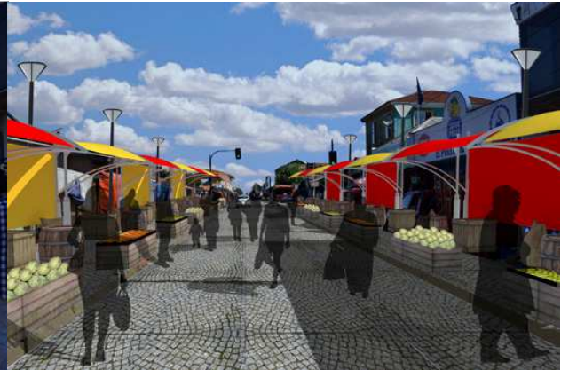
DESPUES: Equipamiento y mobiliario urbano Feria Cañete