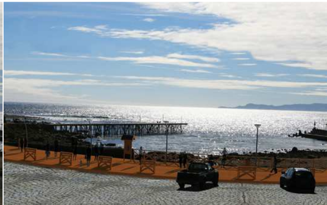
DESPUÉS: Paseo y mirador costanera de Lebu.