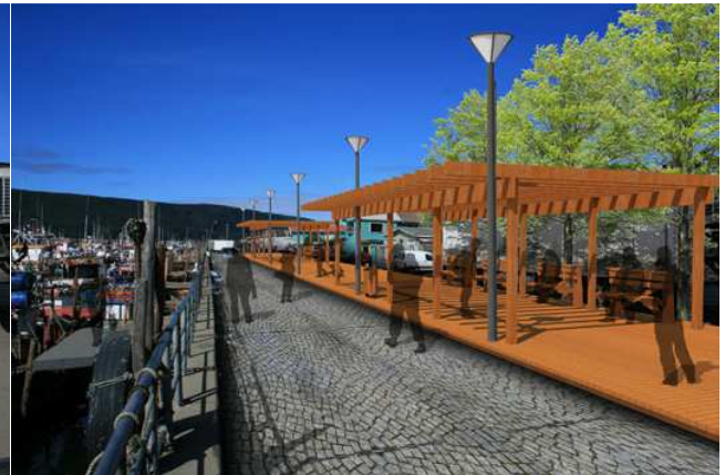
DESPUÉS: Paseo y miradores Costanera de Lebu