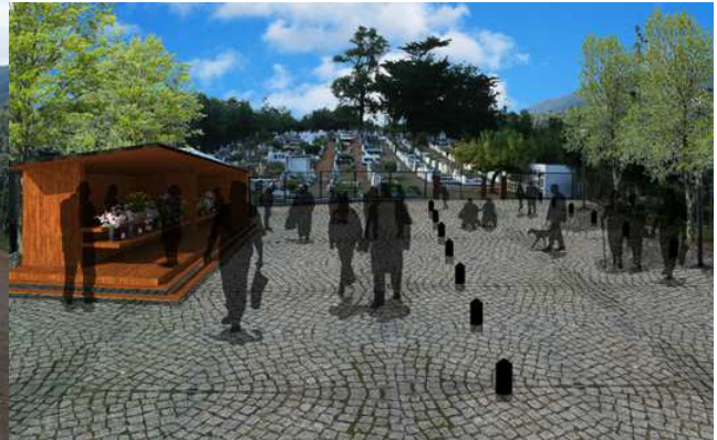
DESPUÉS: Plaza ceremonial y pérgolas de flores Cementerio de Contulmo