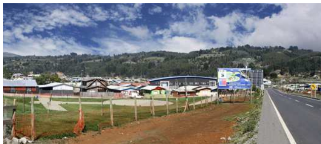
AHORA: Acceso Tirúa