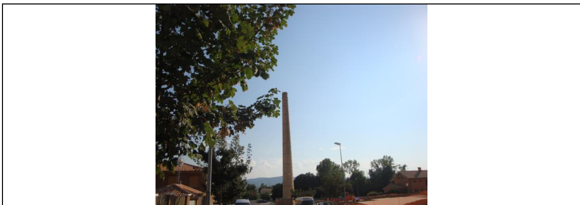
CHIMENEA DE LA TEJERA DE JACA

Solamente puede hablarse del de JACA, en donde se conserva la Chimenea de la Tejera . Ahí, estaría ubicado el único LIPM (Lugares de Interés del Patrimonio Minero) de la comarca.