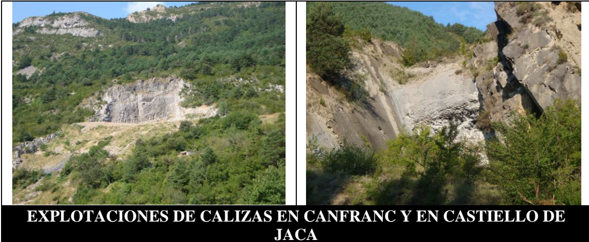
EXPLOTACIONES DE CALIZAS EN CANFRANC Y EN CASTIELLO DE JACA