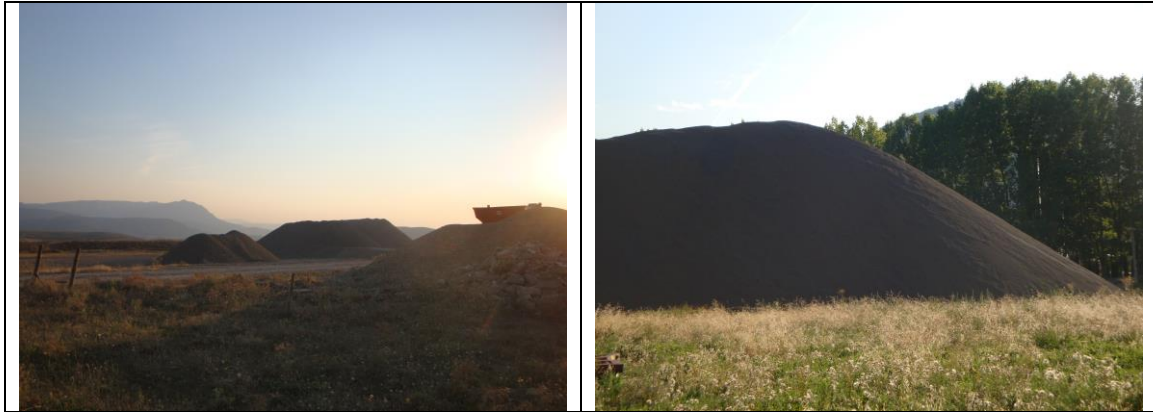
ACÓPIOS DE LAS GRAVERAS DE JACA (CÁNIAS) Y DE PUENTE LA REINA DE JACA