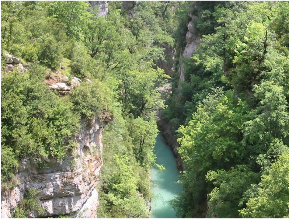
FOTOGRAFÍA 5 (PARADA 4) El Bellos, cerca del Puente del Molino de Aso

En este recorrido iremos pasando por lugares sumamente interesantes de de todos los puntos de vista geológicos. Así, encontraremos un deslizamiento (a la izquierda del río y de la carretera). Luego, habremos visto unas interesantes formas de morfología kárstica, al mismo lado de la carretera. FOTOGRAFÍAS 6 y 7. Más abajo encontraremos los indicativos de una estación termal. FOTOGRAFÍA 8.