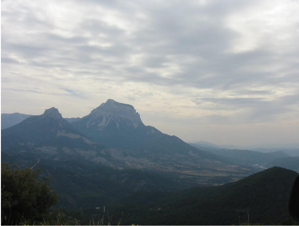
FOTOGRAFIA 9 Peña Solana y Peña Montañesa