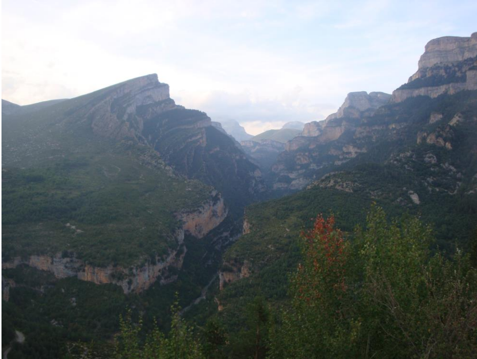
FOTOGRAFÍA 4 El Cañón de Añisclo y el Anticlinal de Mondoto