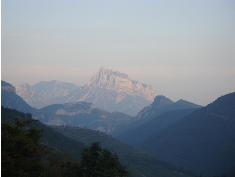
FOTOGRAFÍA 1 Peña Montañesa

Por otro lado, la totalidad del recorrido transitará por la cuenca del río Ara, por el Valle de Viu. Luego se continuará por los afluentes del río Bellos, descendiendo hasta el valle del río Cinca.