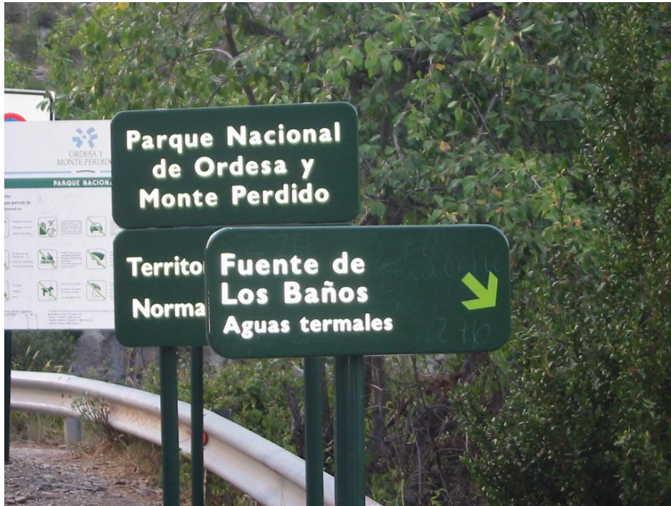
FOTOGRAFÍA 8 (PARADA 5) Plafones indicativos de los baños termales