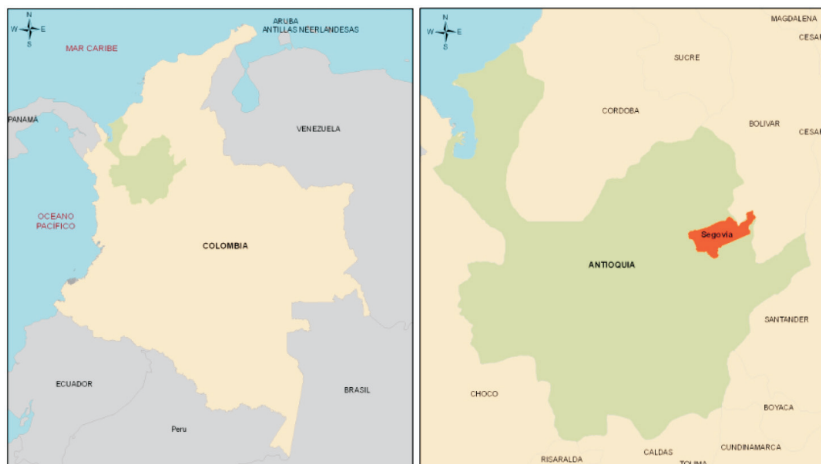
Figura 1. Ubicación del municipio de Segovia

De acuerdo a la información registrada en el SIMCO, para el periodo 2005 - 2011, Segovia en promedio tuvo una producción de 3,421.00 kg de oro. En la Tabla 1, se presenta la producción anual comprendida en este periodo.