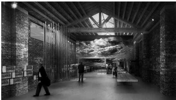
Exposición del pabellón de Catalunya y Baleares en la Biennale di Venezia 2012