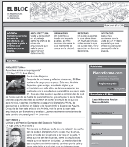
08. PANTALLAZO DEL BLOG EL BLOC DE ARQUITECTURA Y URBANISMO DE BARCELONA.