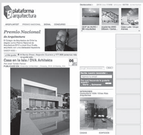
10. PANTALLAZO DEL BLOG PLATAFORMA ARQUITECTURA.