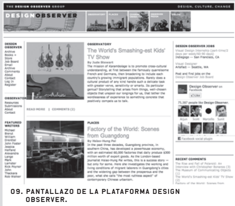
09. PANTALLAZO DE LA PLATAFORMA DESIGN OBSERVER.