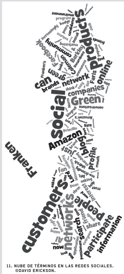
11. NUBE DE TÉRMINOS EN LAS REDES SOCIALES. @DAVID ERICKSON.