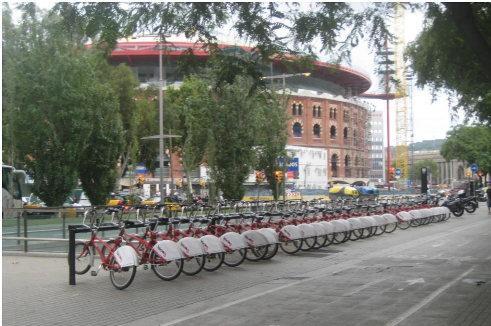
Figura 4. Espacios verdes públicos, ciclovía y andador peatonal