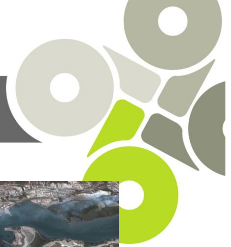
Figura 1. Toma satelital de la ciudad de Mazatlán, Sinaloa México