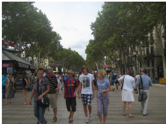
Figura 2. Las Ramblas, Barcelona, España 2010.