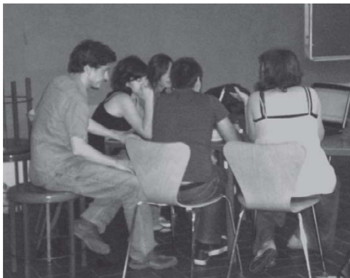
Un dia de classe format taller

Es va programar una sortida amb els estudiants en una de les jornades centrals del taller què finalment no es va fer, dedicant aquest temps al desenvolupament dels treballs.