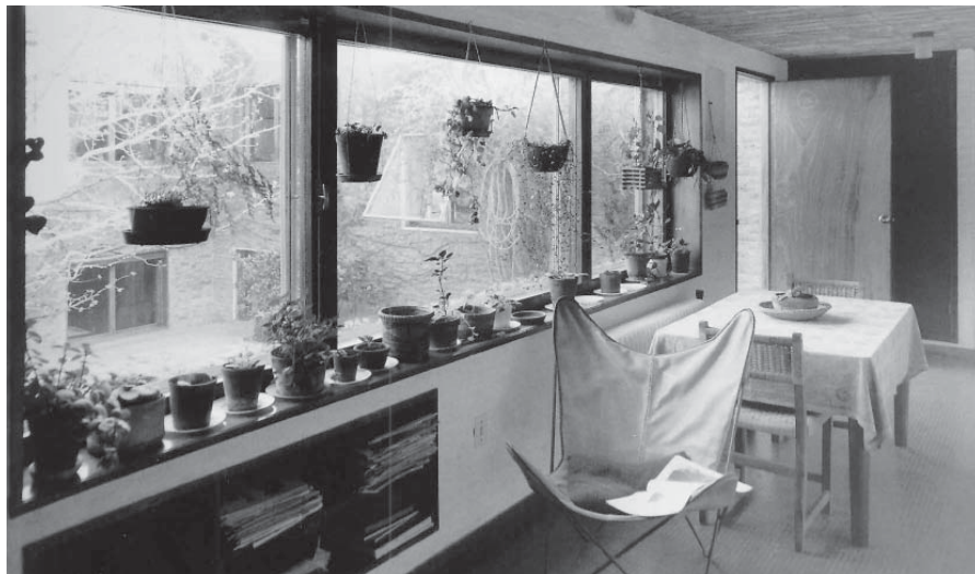
9. Dormitorio de los hijos pequeños.