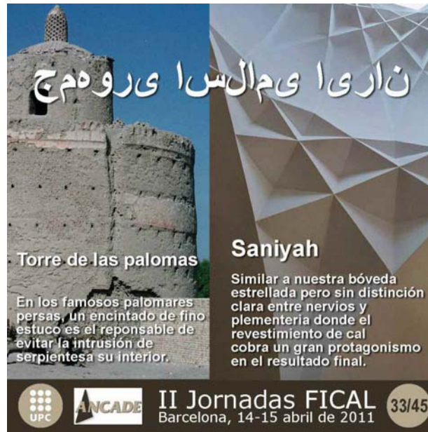
Fig. 3 La cal y sus múltiples usos en la cultura edificatoria persa

mortero de cal recubriendo armazones de caña más cáñamo y que destacan como las primeras representaciones humanas a gran escala [21].