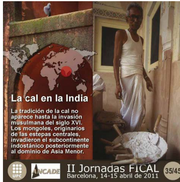
Fig. 4 La manipulación de la cal en la rica tradición artesanal de la india.

Cuando hablamos de la India, existe un texto de consulta obligada a tener en cuenta si queremos indagar sobre la cal en épocas preindustriales en la India. Se trata de El Mayamata que es un Vastusastra, es decir un tratado de edificación que como tal define en todas sus facetas la casa de dios y la de los hombres.