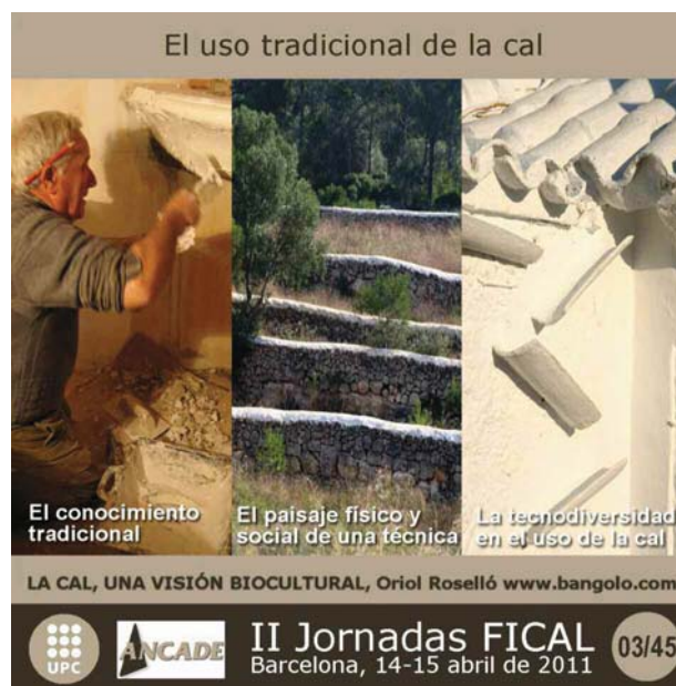
Fig. 1 El conocimiento tradicional de la cal se debe leer a escala territorial y social

Como arquitectos en el modesto sector de la rehabilitación de edificaciones rurales anónimas del Baix Empordà hemos podido comprobar como las técnicas tradicionales han ido perdiendo su función original y global y las que han pervivido han resistido gracias a la sobrevaloración epidérmica asociada a una nostalgia y un prestigio social por parte de cierta elite urbana. Pero han quedado vacías de una comprensión global y originaria del uso de las técnicas tradicionales y se han reducido a lo que el sentido de la vista puede percibirse obviando las complejas y ricas relaciones con el paisaje circundante y la sociedad que los generó [1].