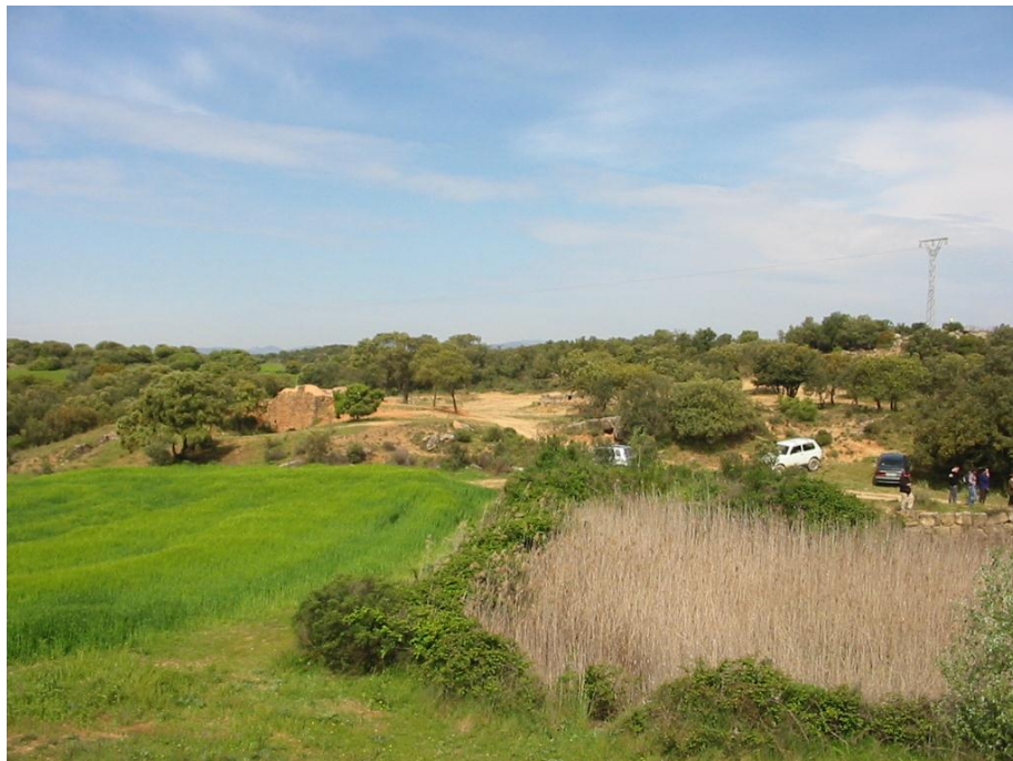
La Teuleria i la Bassa

Després de fer l'aturada anterior, cal retornar cap a la carretera, per tal de parar a la bora de la mateixa, a uns 0'150 m de l'indret anterior.