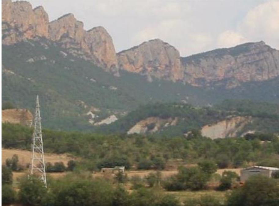
Les margues grises de la Vallan, per sota de l'encavalcament Sudpirinenc

Tanmateix. Mirant cap a l'altra banda, es poden veure un relleus similars, sobre la Vallan. I precisament, des d'aquest indret, es pot veure l'interessant Anticlinal d'Oliana , el qual presenta una direcció NE-SW. Aquest anticlinal es situa sobre els materials eocènics superiors de la Depressió Geològica de l'Ebre , al peu de l' Encavalcament principal sud-pirinenc . Aquest anticlinal s'inclou dintre de l' Avant-país plegat . Els materials eocènics es troben constituïts per nivells de calcutites grisenques, i pertanyen a la Formació Igualada .