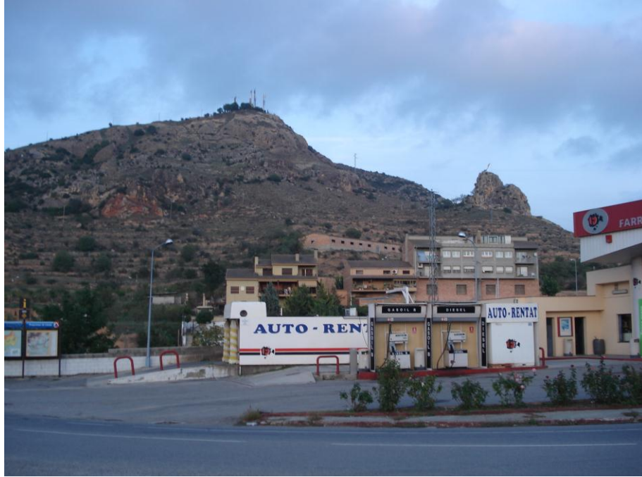
El plec encavalca sobre los materials cenozoics