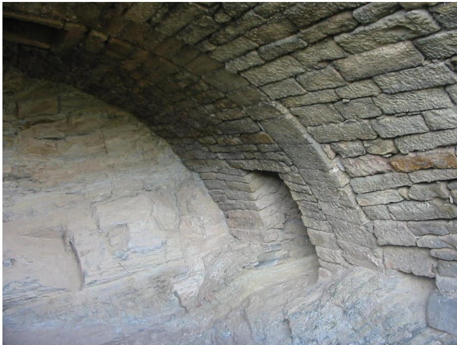
Restes de l'antic Pou de Glaç de Cubells

En aquest indret hi ha un interessant Pou de Glaç, excavat i restaurat els darrers anys. Ara es troba en bon estat de conservació.