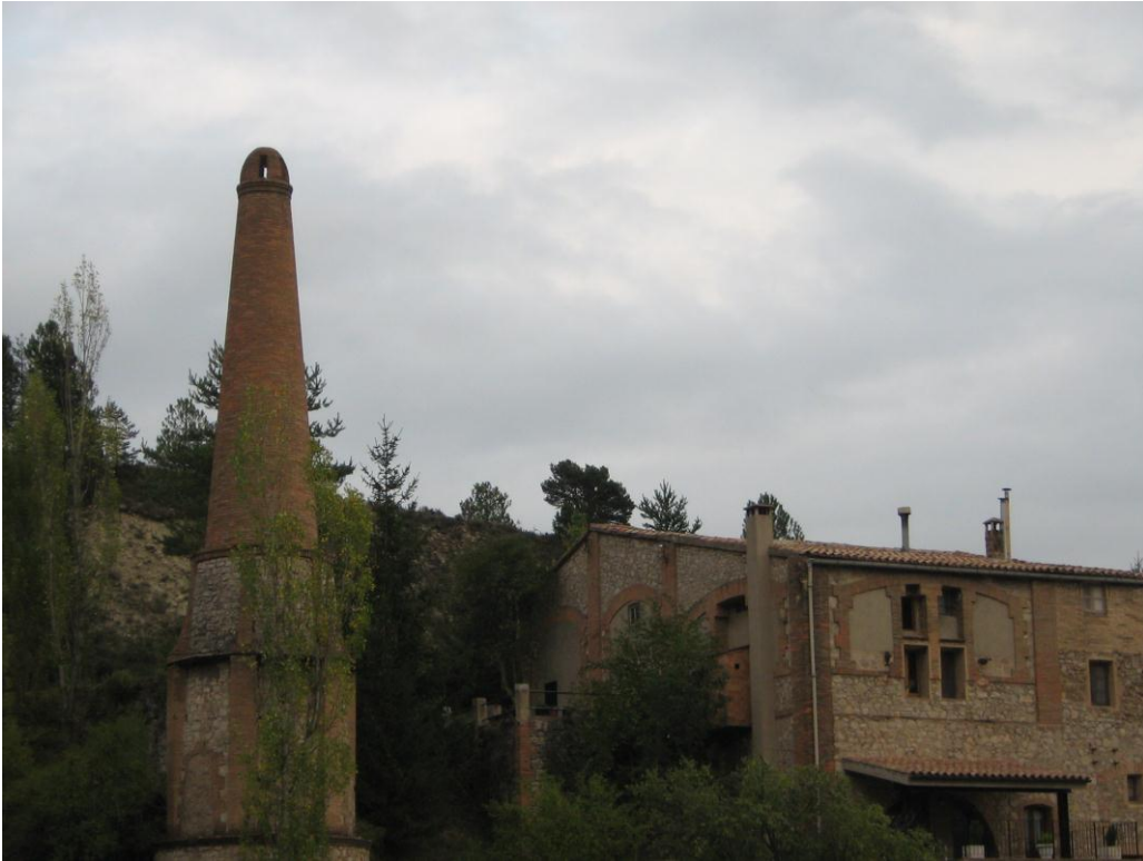
Aspecte de la xemeneia de la fàbrica de petroli