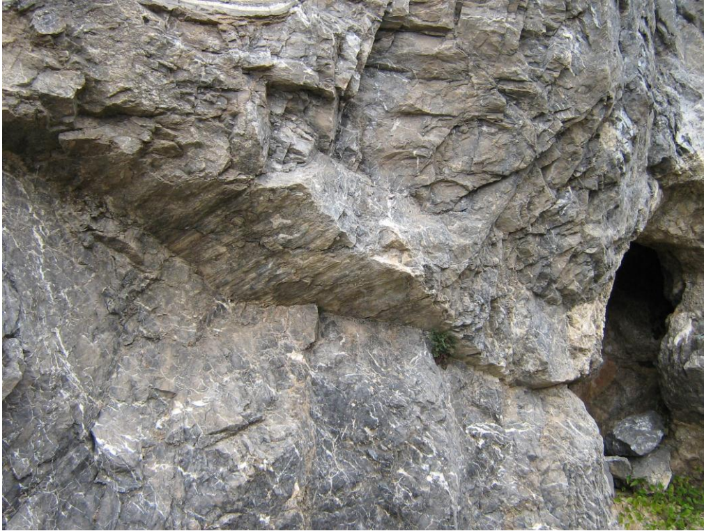
La falla i la coveta

En aquest lloc hi ha una cova, amb abundant presència de CALCITA. La cova es relaciona amb una fractura inclinada que talla als nivells carbonatats. En relació amb la falla es fa clarament palès un interessant mirall de falla , amb unes estries ben definides.