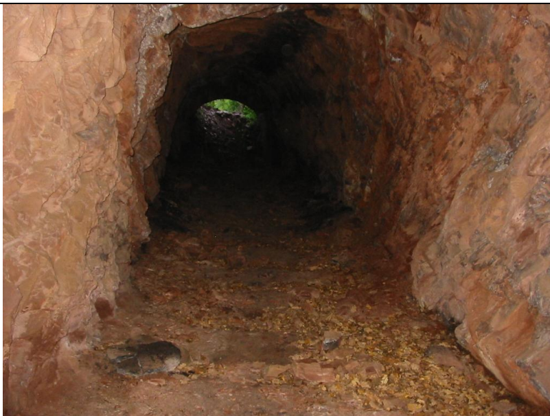
TÚNEL DEL FERROCARRIL MINER

També cal fer esment de l'important patrimoni miner que hi ha en aquest indret: galeries, antigues instal·lacions dels carregadors, pontets dels ferrocarrils miners. Tot i el seu valor, a l'actualitat es troben en un avançat procés de degradació, fent-se força evident que cal una acció decidida per tal de salvaguardar aquest patrimoni.