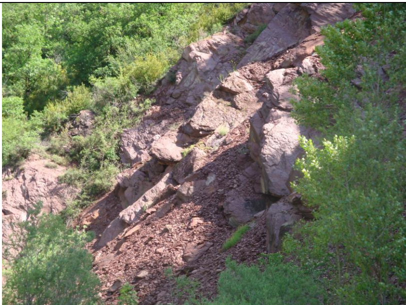
PEDRERA DE GRESOS

Després de fer l'aturada anterior, cal fer un altre petit recorregut, per tal d'arribar fins a una antiga explotació de gresos situada a la vora de la carretera. Així, haurem fet un recorregut un xic inferior als 0'5 Km.