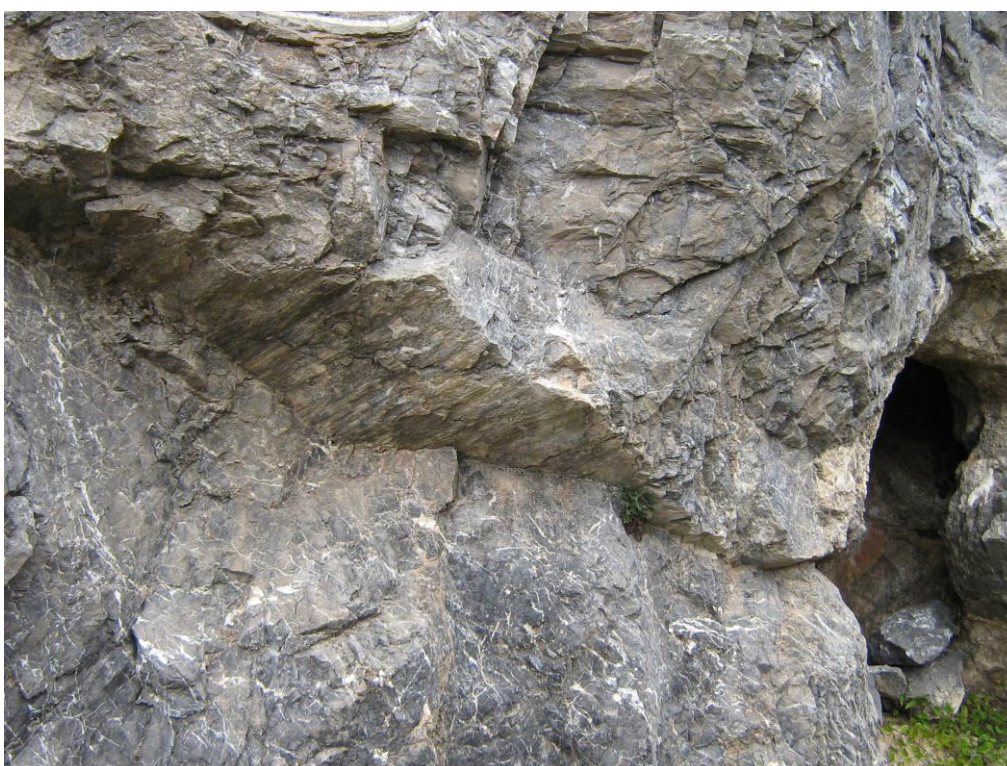
La falla i la coveta

En aquest lloc hi ha una cova, amb abundant presència de CALCITA. La cova es relaciona amb una fractura inclinada que talla als nivells carbonatats. En relació amb la falla es fa clarament palès un interessant mirall de falla , amb unes estries ben definides.