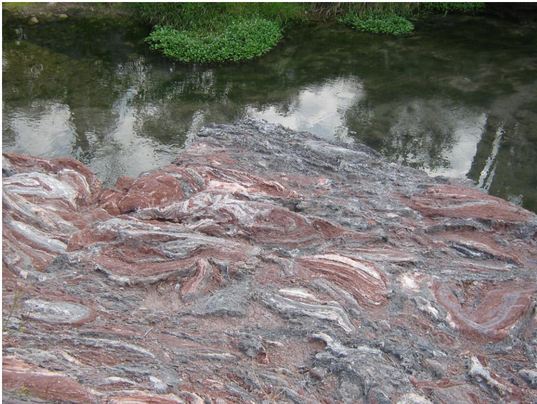
Aspecte dels guixos del Keuper a Guardiola del Berguedà

Aquests nivells del Triàsic Superior, es situen a l'encavalcament dels materials mesozoics del Mantell Inferior del Pedraforca (que es troben al Sud), sobre els cenozoics i mesozoics del Mantell del Cadí , que es troben al nord. És a dir: l'encavalcament d'un mantell sobre l'altre es situa cap els voltants de Guardiola de Berguedà.