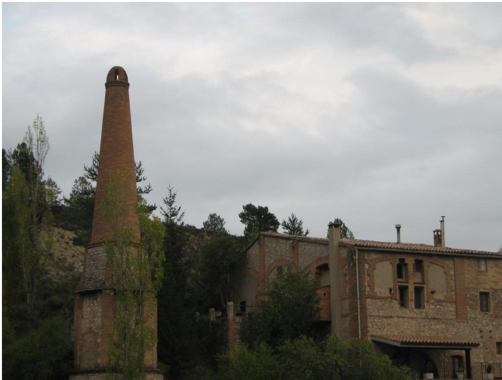
Aspecte de la xemeneia de la fàbrica de petroli

Dintre de la població es farà una aturada als edificis on era tractat el petroli extret a les Mines de Riutort, de petroli. Aquestes instal·lacions constitueixen un indret força interessant del nostre patrimoni miner.