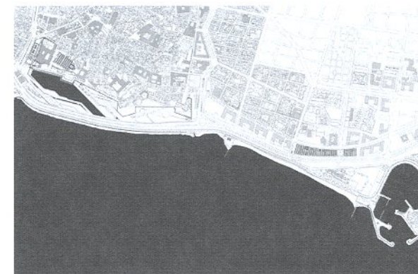
PLANTA GENERAL DEL SEGON PREMI, L'EQUIP ALEGRE-LLOVERAS I BALANZÓ-BARCELÓ

El sol, la mar i el vent com a fonts d'acondicionament climàtic de l'edifici. La façana al mar, un tamís protector del sol, permet diverses escales de lectura de l'edifici al lloc: a llarga distància, la visió unitària i canviant al trànsit del sol, des dels vaixells que arriben a la badia de Palma; a mitjana distància, la percepció esbiaixada que descobreix el gruix de l'edifici; en la proximitat, la qualitat tàctil del material.