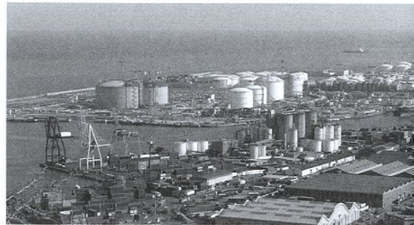
ZONA D'INTERVENCIÓ. ZONA FRANCA DE BARCELONA