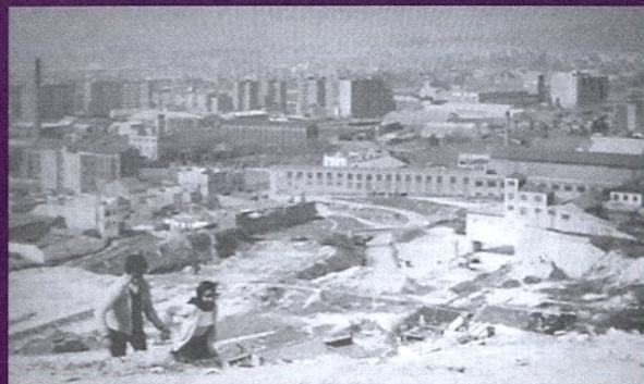
LOS TARANTOS, FRANCISCO ROVIRA BELETA, 1963

LA CIUDAD DE LA NOSTALGIA, LA CIUDAD DEL RECUERDO, LA CIUDAD SIN NOMBRE, LEJANA.