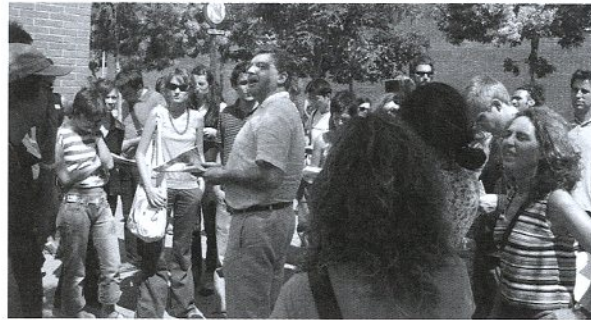
ESTUDIANTS DEL TALLER D'ESTIU, JULIOL DE 2005