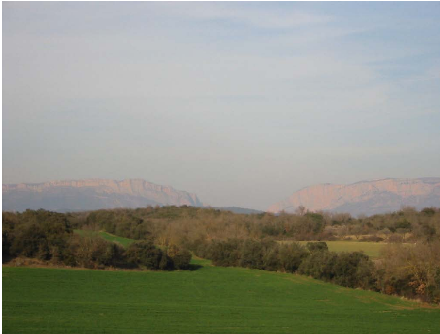
El Congosto de Bon Rebei (o Pas de Bon Rebei), desde las inmediaciones del Vértice Geodésico de la Creu (la Cruz)

Central Surpirenaica , en donde nos hallamos y nos hallaremos a lo largo de todo el recorrido de este itinerario.