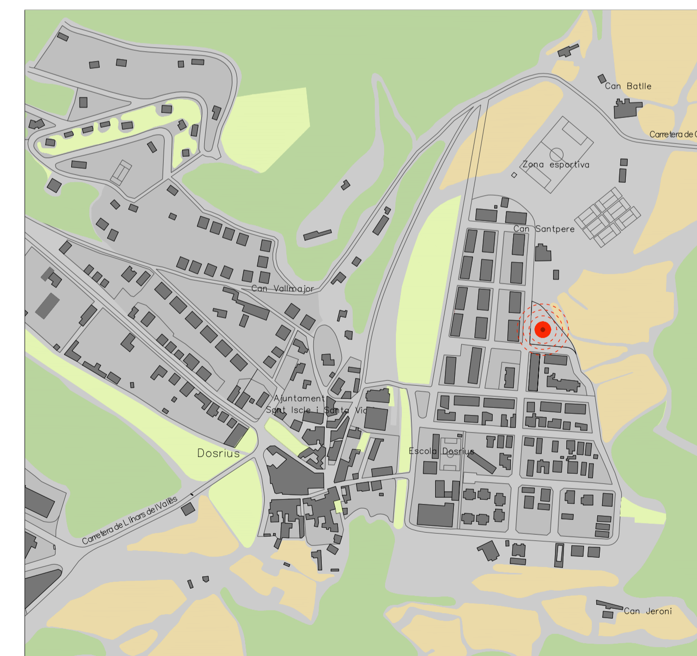
ESQUEMA D'ESPAYS VERDS I RELACIÓ AMB EL BUIT I PLÈ

L'emplaçament on s'ubica aquest projecte es troba a la part nord-est del poble, on si fan i hi són previstes varies intervencions urbanes, el terreny d'intervenció d'aquest projecte és triangular i es troba en el límit actual urbanitzable d'aquest sector, delimitat per dos carrers perpendiculars per sud-est i sud-oest, la riera de dosrius pel nord i un talús pel nord-est. aquest talús és de 2,5 metres d'alçada i és adjacent al sector agrícola, on si ubica una pollancreda al llarg de la riera.