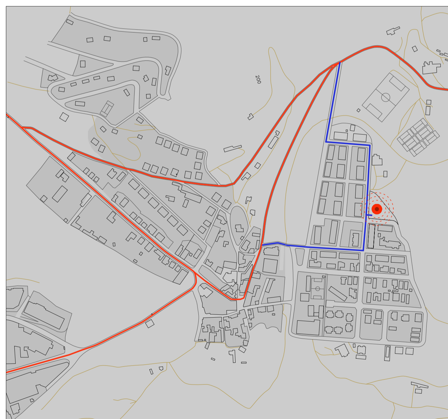
ESQUEMA DE CIRCULACIÓ

— Viari principal — Accés rodat — Camins no asfaltats