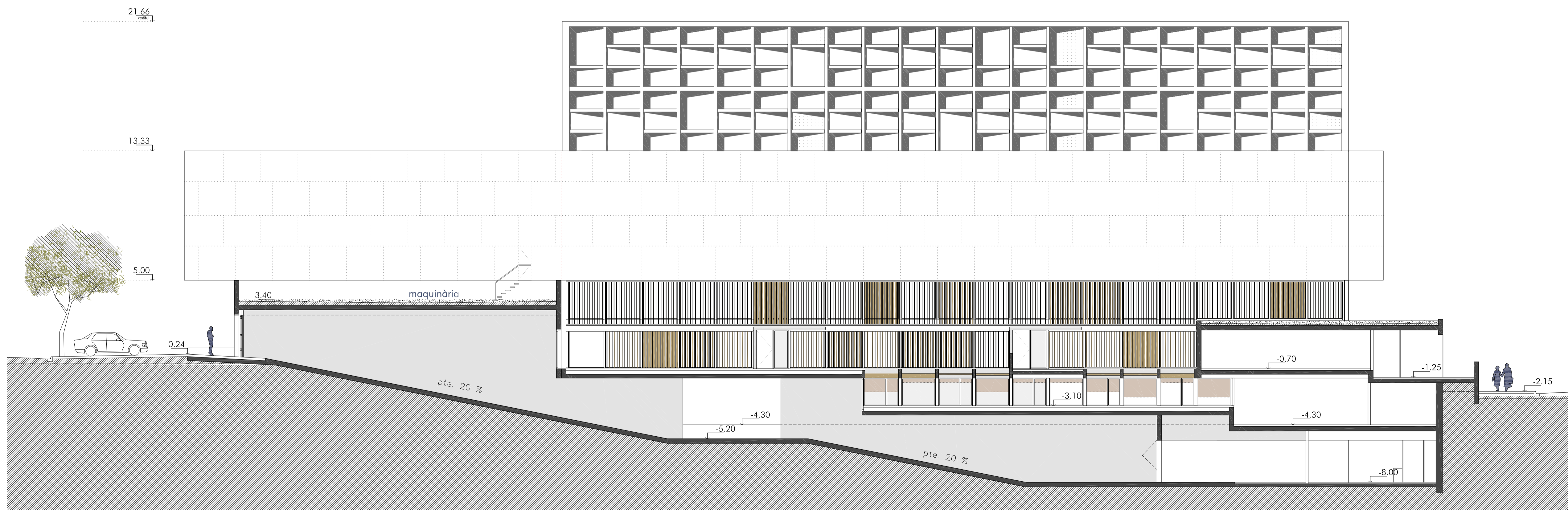
ALÇAT D INSTITUT DE SECUNDÀRIA SAN SEBASTIAN