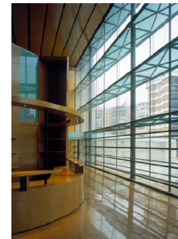
Biblioteca Pública de Ivencarral, Andrés Perea Arq.

Requeriment transparència, aïllament acústic. Servirà de separador mentre mantenim l'espai visual.