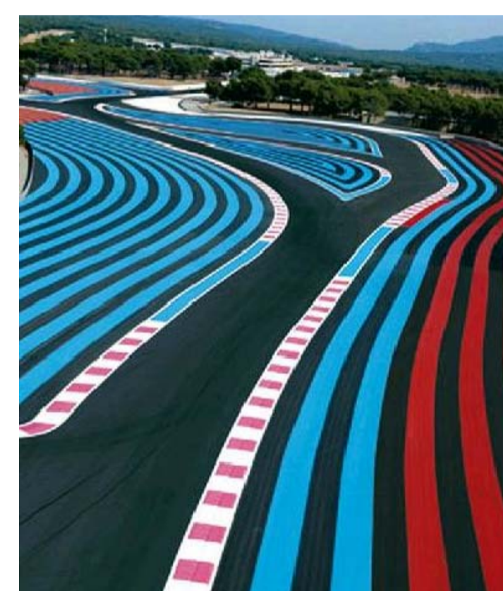
Circuit de F1 Paul Ricard (França) - Formigó tintat antilliscant