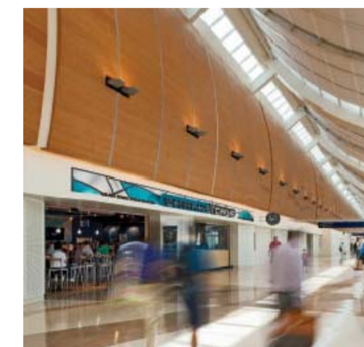
Mineta San Jose, Airport