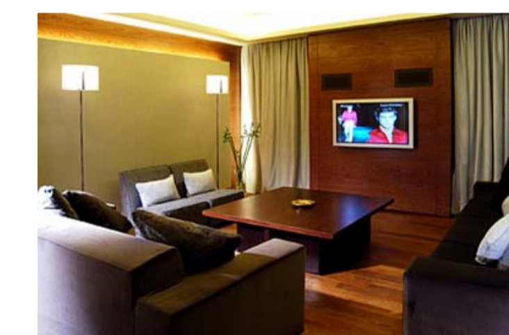
Variu paviment per l'interior, del continu a la fusta