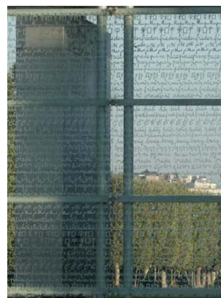
Exemple vidre senygrafat en façana