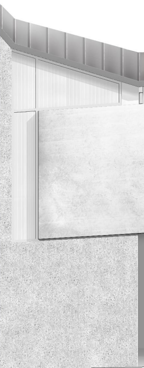
alçat façana nord escala 1:100