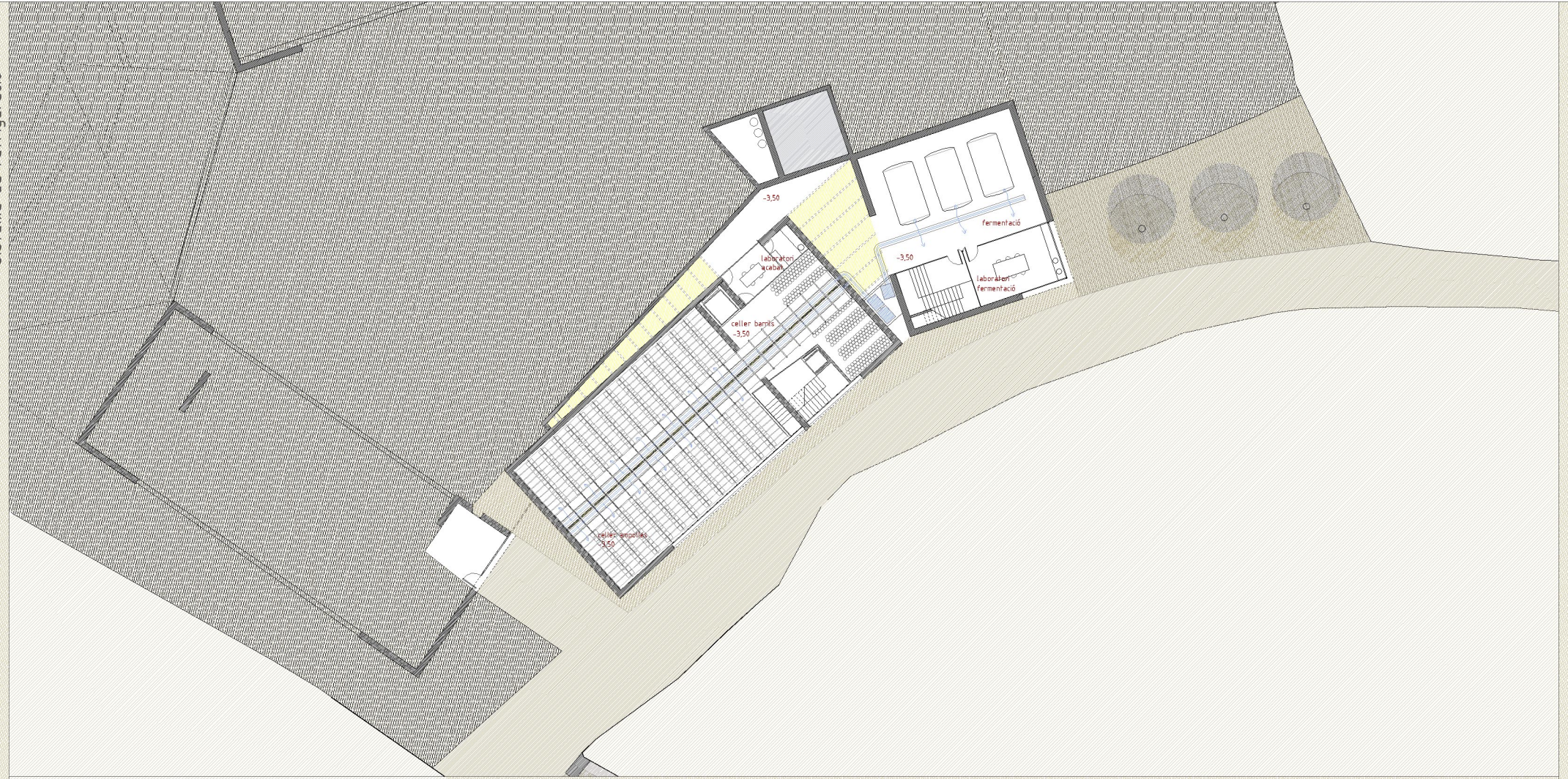
planta soterrani _secció a cota +0,00